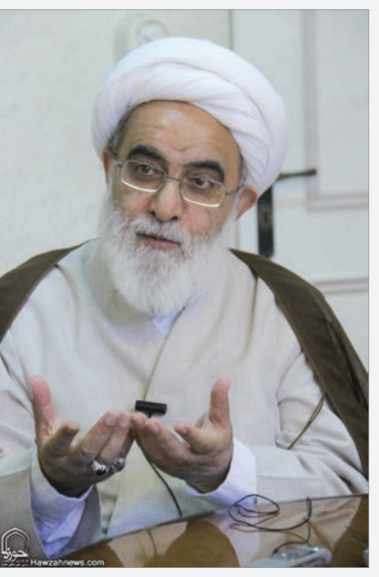
آیت‌الله شب‌زنده‌دار در ادامه گفته: من دیروز در مشهد به طلاب عرض کردم که این بیانیه را مثل کتب درسی به مباحثه بگذارید و بعد در راه نشر و تبیین و پیاده‌سازی آن تلاش کنید. خود ما هم هر روز یک بخشی از بیانیه را همین جا قرائت خواهیم کرد.

آیت‌الله شب‌زنده‌دار در جلسه درس خارج فقه خود با اشاره به دیدار اخیرش با رهبر انقلاب، روایتی را از آن چه ایشان درباره «بیانیه گام دوم انقلاب» گفته بودند نقل کرد. استاد دروس خارج حوزه علمیه قم با اشاره به دیدار اخیرش با رهبر انقلاب خاطرنشان کرد: مقام معظم رهبری در این دیدار درباره اهمیت این بیانیه فرمودند: «من روی این بیانیه خیلی زحمت کشیدم... من بنای بر این ندارم که اگر چیزی نوشتم یا مطلبی می‌گویم از دیگران درخواست کنم که روی آن کار کنند ولی راجع به این می‌گویم این کار را بکنند.» این درخواست و مطالبه را ایشان دارند.