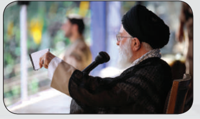
آیت الله العظمی مکارم شیرازی: