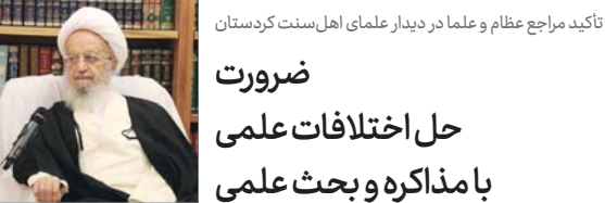
تأکید مراجع عظام و علما در دیدار علمای اهل سنت کردستان