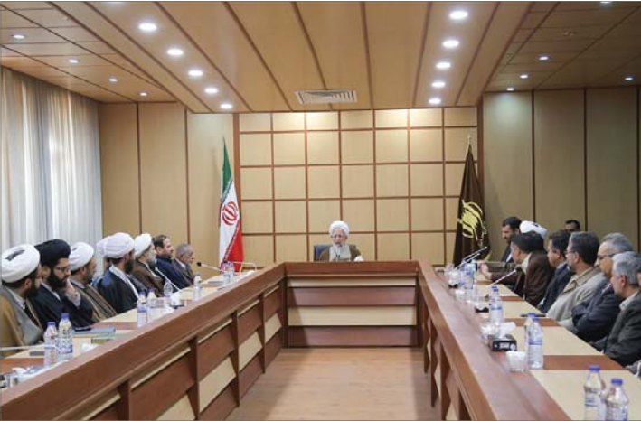
در دیدار مراجع عظام عنوان شد

و تحقیق و پژوهش خود را پیش ببرند. ایشان با بیان این مطلب که کتابخانه‌ها ذخیره و سرمایه‌های ملی کشور هستند، اذعان داشتند: دشمنان در گذشته تنها نفت و گاز ما را به غارت نبردند؛ بلکه بسیاری از کتب و نسخ خطی ما نیز توسط آن‌ها به غارت رفت. اکنون این وظیفه کتابخانه‌های تخصصی کشور است که میراث فرهنگی کشور را حفظ کنند.