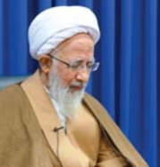
در پیام آیت‌الله العظمی جوادی آملی به نهمین گردهم‌آیی اساتید علوم عقلی تصریح شد

این‌که شبکه‌های خارجی بسیار زیادی برای تفرقه‌افکنی راه‌اندازی شده‌اند، معلوم است نقشه‌ای پشت پرده وجود دارد.