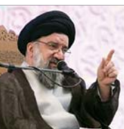
در همایش «صیانت و پیشگیری ویژه روحانیت» بررسی شد

ما مکلف به عرفان نیستیم، ما مکلف به برهان هستیم. ما به فهم، به استدلال مکلف هستیم، دسترسی هم داریم؛ اما به ما گفتند ترویج آن طرف.