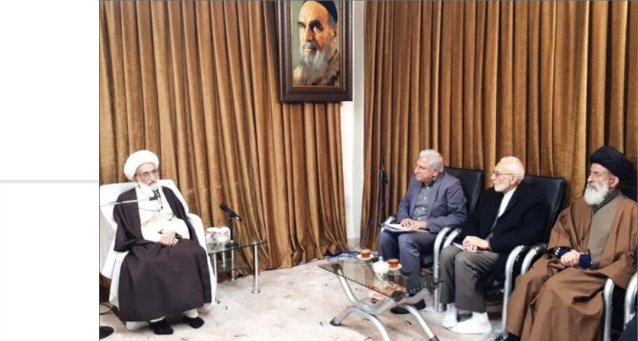
در دیدار مراجع عظام تقلید و علما با دبیرکل مبارزه با دخانیات عنوان شد

اشتراک افق حوزه ۰۲۵ - ۳۲۹۰۰۵۳۶ ۰۹۱۹۶۹۱۴۴۵۰ نمبر: ۳۲۹۰۱۵۲۳