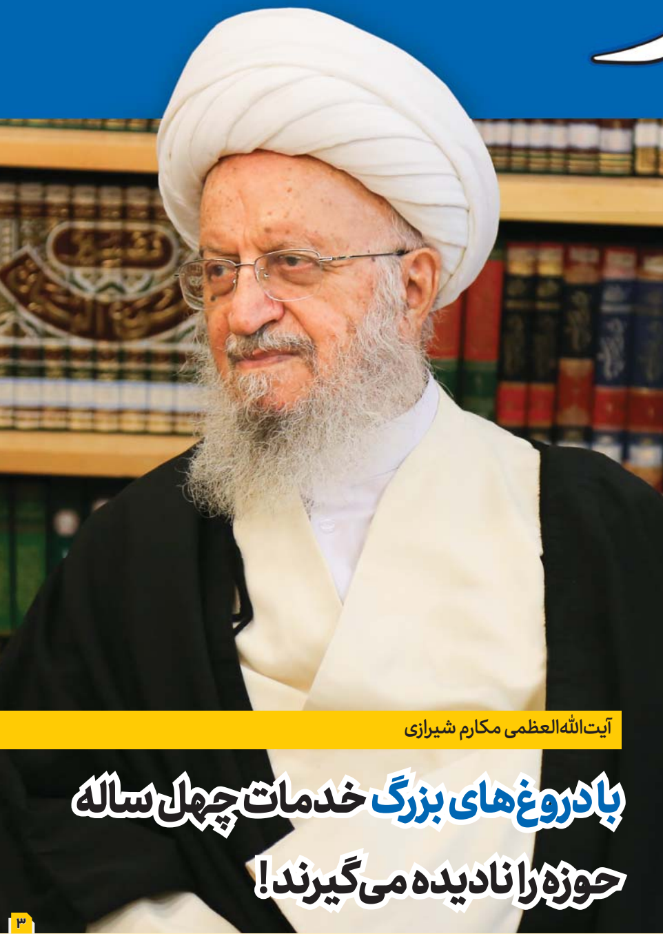
آیت‌الله العظمی مکارم شیرازی

در این کشور تنها چیزی که تحریم نیست، سیگار است و آمریکا که جلوی ورود همه چیز را به ایران گرفته؛ اما جلوی ورود سیگار را نگرفته است! یکی از وارد کنندگان سیگار، کمپانی‌های آمریکایی و اسرائیلی است؛ یکی از این کارخانه‌های اسرائیلی در کشور نمایندگی زده که نشان از برنامه وسیع دشمنان برای نابودی جوانان ایرانی است.