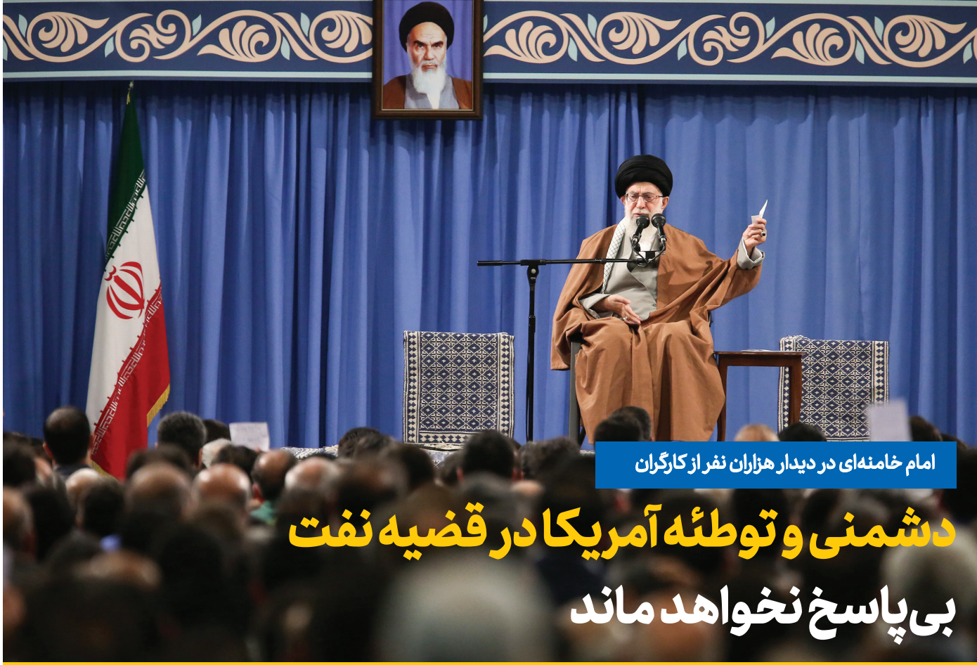
امام خامنه‌ای در دیدار هزاران نفر از کارگران

رهبر انقلاب در پایان سخنانشان تأکید کردند: همان‌گونه که اخیراً گفته شد، تلاش‌های دشمنان آخرین نفس‌های دشمنی آنان است و دشمنان سرانجام از خصومت علیه ملت ایران خسته خواهند شد اما این ملت از کار و تلاش و پایداری و پیشرفت هیچ‌گاه خسته نخواهد شد.