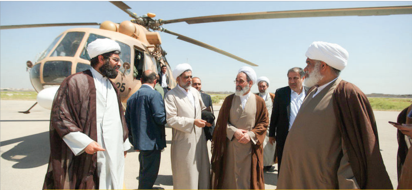
در سفر مدیر حوزه‌های علمیه به مناطق سیل‌زده خوزستان مطرح شد

معظم‌له با تأکید بر این‌که عمل شما بیش از سخن‌تان تأثیرگذار است، ابراز داشتند: اگر مردم شما را خوش‌اخلاق، متواضع و ایثارگر ببینند به مراتب بیش از سخن‌تان تأثیرگذار خواهد بود.