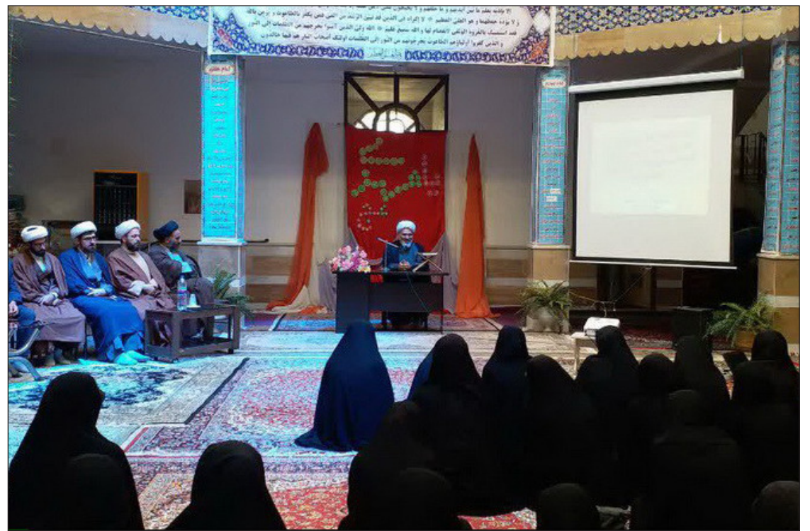
مدیر حوزه‌های علمیه خاوران کشور در خرم‌آباد: