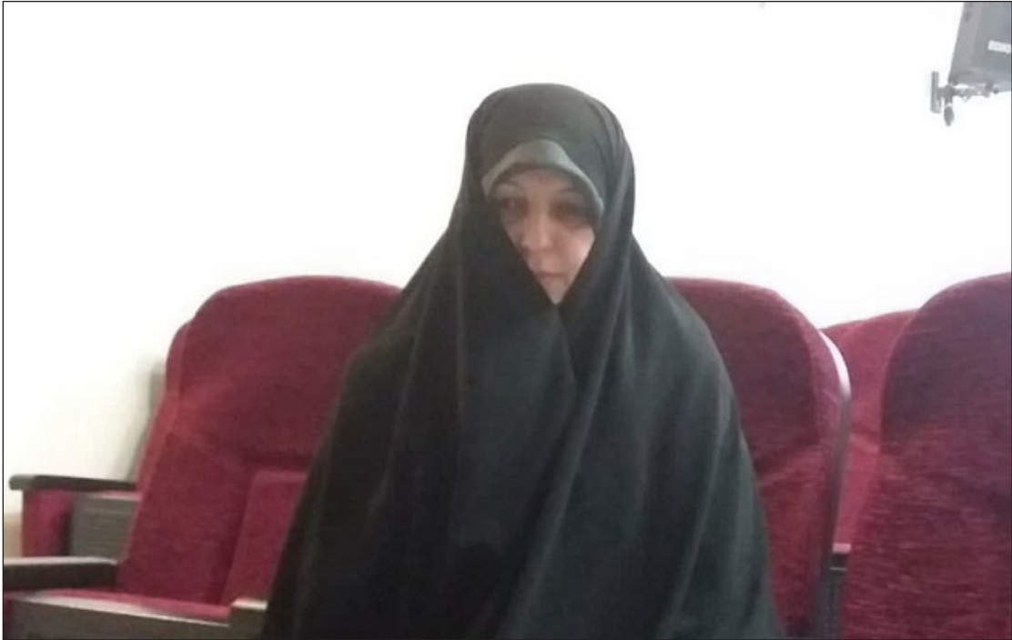
معاون فرهنگی حوزه علمیه خواهران تهران خبر داد:

استاد حوزه علمیه خواهران عنوان داشت: برای این که بتوانیم در این عرصه حضور فعال و مستمر داشته باشیم باید از ظرفیت دانش آموختگان مدارس علمیه خواهران استفاده کنیم. هم اکنون با همکاری مدیران و معاونت های فرهنگی مدارس؛ اطلاعات علمی و مهارتی حدود ۶۰۰۰ هزار دانش آموخته را احصاء کرده ایم و درصددیم تا با تکمیل دیگر اطلاعات و توانمندی های این افراد، بتوانیم متناسب با علایق، مهارت ها و استعداد های افراد مشاوره ها و کارگاه های تخصصی، مطابق با نیازهای کنونی جامعه برای دانش آموختگان برگزار نماییم. بعد از این مرحله بخش های مختلف جامعه می توانند