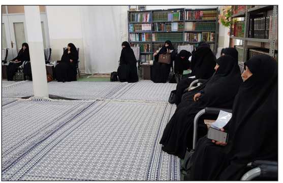
معاون پژوهشی حوزه های علمیه خواهران در تهران: