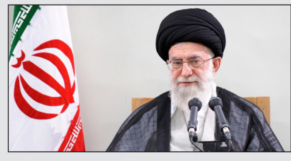
مدیر حوزه های علمیه برادران کشور:

غریبه‌ها درباره جنس زن باید پاسخگو باشند؛ چون آنها به زن خیانت کردند. تمدن غربی به زن هیچ نداده است. اگر پیشرفت علمی، سیاسی و فکری هم در زنان دیده می‌شود، مال خود زندهاست. در هر کشوری چنین پیشرفتهایی نصیب زنان شود - که در ایران اسلامی و در کشورهای دیگر هم شده است - مال خود زندهاست. آنچه که غریبه‌ها به آن دامن زدند و تمدن غربی پایه‌گذار خست کج و بنای کجش بود، ببیندوباری و ابتذال زنانه است. زن را به ابتذال کشانده‌اند و داخل خانواده او را هم اصلاح نکرده‌اند. مکرز در مطبوعات آمریکایی و اروپایی، میزان بالای زن‌آزاریها و شکنجه‌ها و بیمه‌ریها منتشر شده است. ۱۳۷۹/۰۶/۲۰