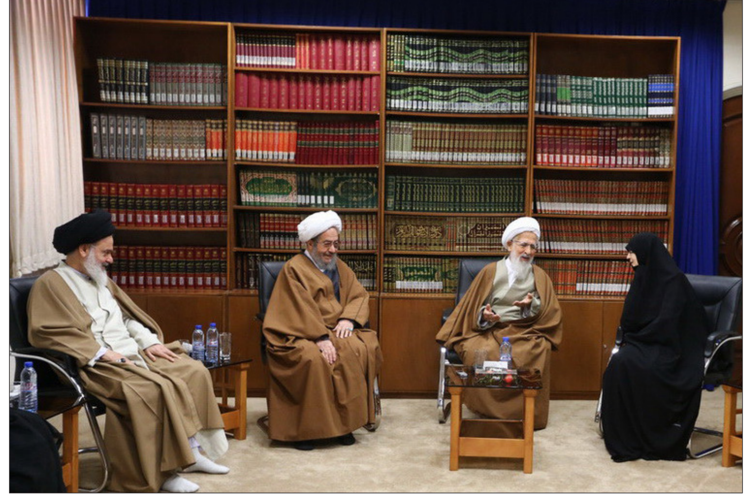
آیت الله العظمی جوادی آملی:

آیت الله مقتدایی در ادامه این دیدار عنوان کرد: حوزه های علمیه خواهران یکی از برکات