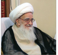
توصیه مراجع عظام و علما به مسئولان دانشگاه‌ها

برقراری رابطه پررنگ بین علوم ورفع نیازهای جامعه