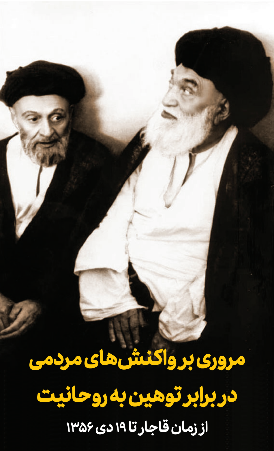
ادامه در صفحه بعد

این اهانت‌ها نتنها موجب محبوبیت و عزت مصدق نشد، بلکه به سرعت وی را در مسیر قهقراپی قرار داد. نتیجه این اقدامات تنهایی مصدق و جدایی یاران پیشین خود از سویی و نیزافت فاحش محبوبیت او بود. و البته بی‌تفاوتی مردم نسبت به برکناری وی توسط آمریکا به کمک چندتن از اوباش و فواحش، گواه آخرین خطای وی بود. (۸)