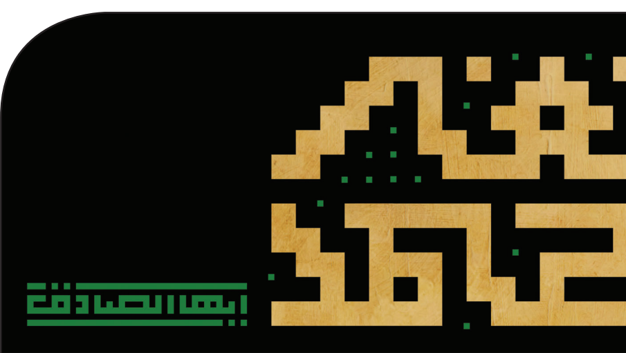
وصیت‌نامه سیاسی الهی امام خمینی‌علیه السلام

رئیس مذهب شیعه در بیان آیت‌الله‌العظمی جوادی آملی