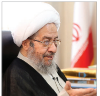
آیت‌الله مقتدایی در بازدید از رسانه رسمی حوزه

با نوآوری است که پیشرفت کشور عملی می‌شود، دانشگاه‌ها باید با نیازهای ملموس مردم رابطه نزدیک داشته باشد.