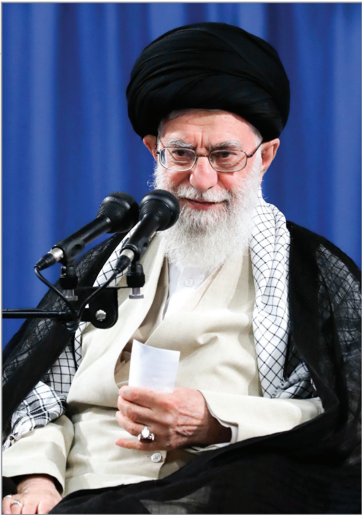
امام خامنه‌ای در دیدار رئیس، مسئولان و جمعی از قضات و کارکنان قوه قضاییه