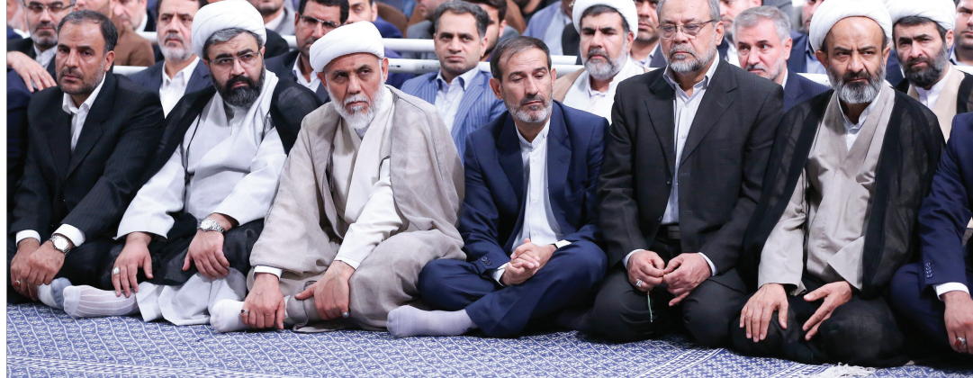
رئیس دستگاه قضایی با اشاره به آمادگی قضات و کارکنان قوه قضاییه برای تحول زمان‌بندی شده در این دستگاه، افزود: مادر دستگاه قضایی به دنبال کاهش جمعیت کیفری، کاهش ورودی پرونده، اصلاح نظام دادرسی و برطرف شدن موانع فرایند دادرسی هستیم.

ایشان، پیروزی انقلاب را نقطه بیرون آمدن ملت از «لاک‌ذلت و توسری خوری» برشمردند و خاطرنشان کردند: در چهار دهه اخیر، تلقیف هویت ایرانی با خصوصیات اسلامی، موجب شده فشارهای زورگویان