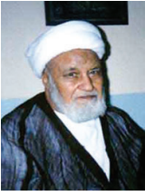
حاج شیخ علی قاضی زاهدی گلپایگانی رحمه الله