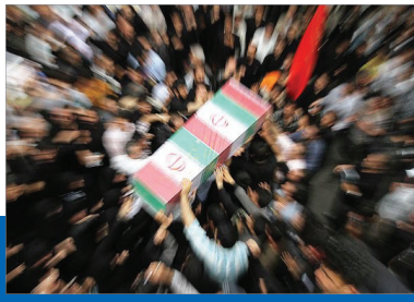
تهیه و تنظیم:علی‌اکبر بخشی

الآن جنازه خونین من جلوی چشم شماست، بدون این‌که ذره‌ای از مال دنیا همراه داشته باشم، شما مرا تنها خواهید گذاشت و آن‌چه که در قبر همراه بنده است، عمل من است. بنده با آگاهی کامل و دید و بصیرت کافی به جبهه رفتم و جانم را دادم و اگر الآن خداوند جان دیگری به بنده بدهد، دوباره به جبهه خواهم رفت.