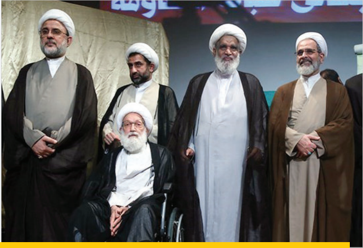
در همایش بزرگ جهانی «شباب المقاومة» تصریح شد

آیت‌الله خاتمی عنوان کرد: امروز نبض حوزه‌های علمیه توسط طلاب می‌تپد و باید این مراکز و مدارس علمیه به‌خوبی تأثیرگذار باشند؛ لذا باید در عرصه اخلاق و برجستگی علمی سرآمد باشند.