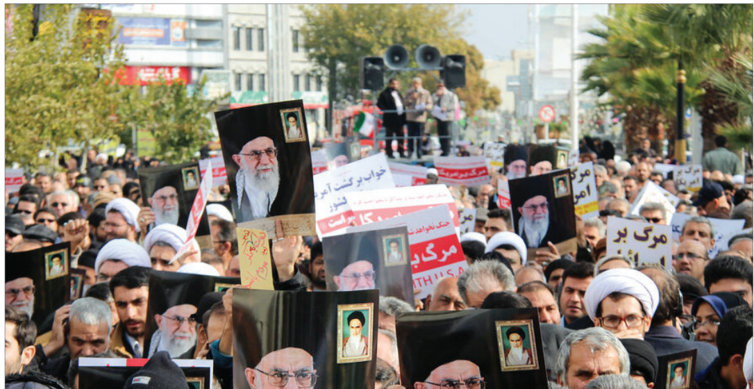
در بیانیه جامعه مدرسین و مجمع نمایندگان طلاب در محکومیت اغتشاشات اخیر تأکید شد

باید همه مسئولین، قدردان رهبر حکیم و فرزانه و چنین ملت وفادار، با بصیرت و شجاع باشند و خود را مدیون رهبری نظام و مردم همیشه در صحنه بدانند و قدردانی خود را در عمل نشان بدهند؛ ما نمی‌دانیم با چه زبان و قلمی شکوه و عظمت مردم عزیز ایران