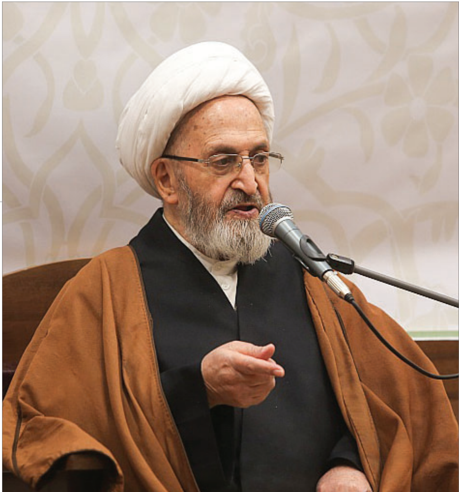
متن کامل بیانات آیت‌الله‌العظمی سبحانی در مراسم بزرگداشت سی و هشتمین سالگرد علامه طباطبایی رحمته‌الله‌علیه