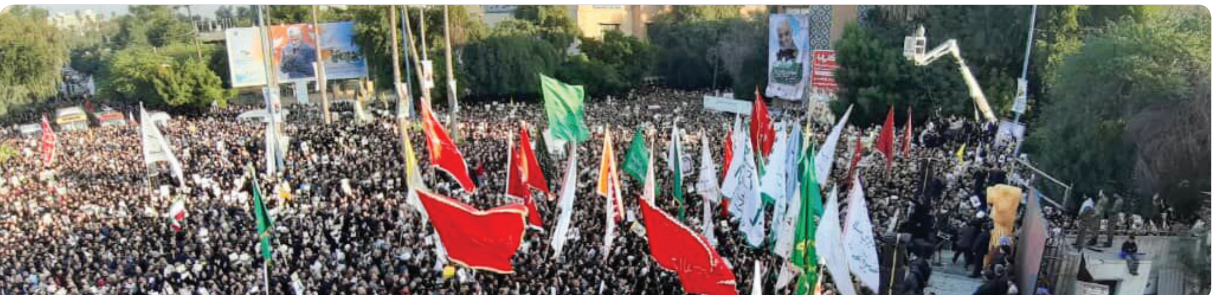
• تشییع پیکر سردار سپهبد شهید حاج قاسم سلیمانی و شهید ابومهدی المهندس و یاران شهیدش در اهواز