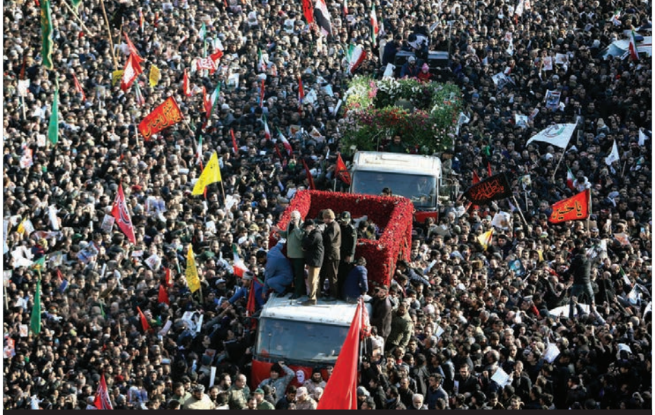
ادامه از صفحه ۳

من از شنیدن خبر شهادت حاج قاسم سلیمانی فوق‌العاده متأثر شدم و ان‌شاءالله خدا روح ایشان را را شاد کند و به بازماندگان صبر دهد. او می‌دانست که شهادت در کنارش است. روزی گفتش را آورد من امضا کنم. هرچند به او گفتم که شما فرق این امضا هستید؛ اما کفن ایشان را امضا کردم. معلوم می‌شود، او در راه رفتن بود و این مسئله را احساس کرده بود و خدا او را با شهدای کربلا محشور کند.