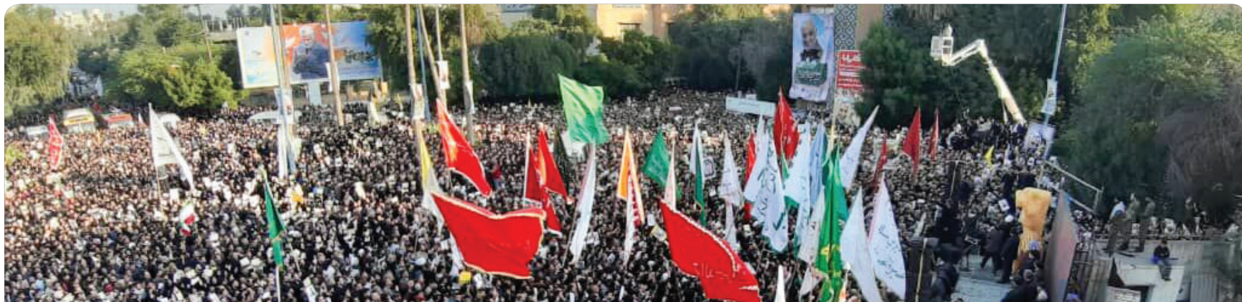
• تشییع پیکر سردار سپهبد شهید حاج قاسم سلیمانی و شهید ابومهدی المهندس و یاران شهیدش در مشهد