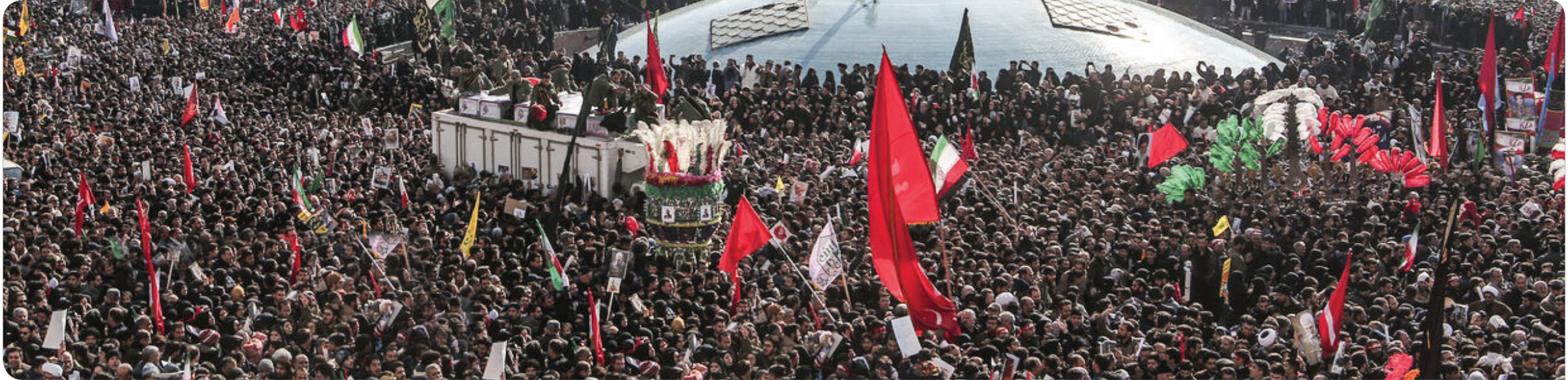
• تشییع پیکر سردار سپهبد شهید حاج قاسم سلیمانی و شهید ابومهدی المهندس و یاران شهیدش در تهران

شورای عالی حوزه‌های علمیه شهادت حاج قاسم سلیمانی و سردار مجاهد ابومهدی المهندس و هم‌زمانشان را به محضر حضرت بقیة‌الله‌الاعظم علیه ، مقام معظم رهبری علیه و تمام مظلومان جهان و مجاهدان و رزمندگان جبهه مقاومت تسلیت عرض نموده و برای ملت عزیز ایران و عراق و خانواده‌های این عزیزان صبور و اجر جزیل از خداوند متعال مسئلت می‌نمایم.