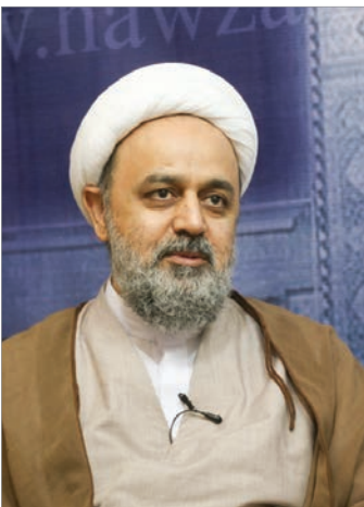
سپرپرستی آن‌ها را بپذیریم. حجت‌الاسلام والمسلمین شهریاری با اشاره به اینکه ما باید انسان‌های صابر

دبیرکل مجمع جهانی تقریب مذاهب اسلامی با اشاره به اینکه حضرت محمد صلی‌الله‌علیه‌وآله‌وسلم فرمودند که بعد از من این جبل متادوم دارد، خاطرنشان کرد: این‌طور نیست که با رحلت پیامبر صلی‌الله‌علیه‌وآله‌وسلم این جبل منقطع شود. وحی منقطع می‌شود، ولی حبل‌اللهی که اتصال به سماء و ارض است، منقطع نمی‌شود.