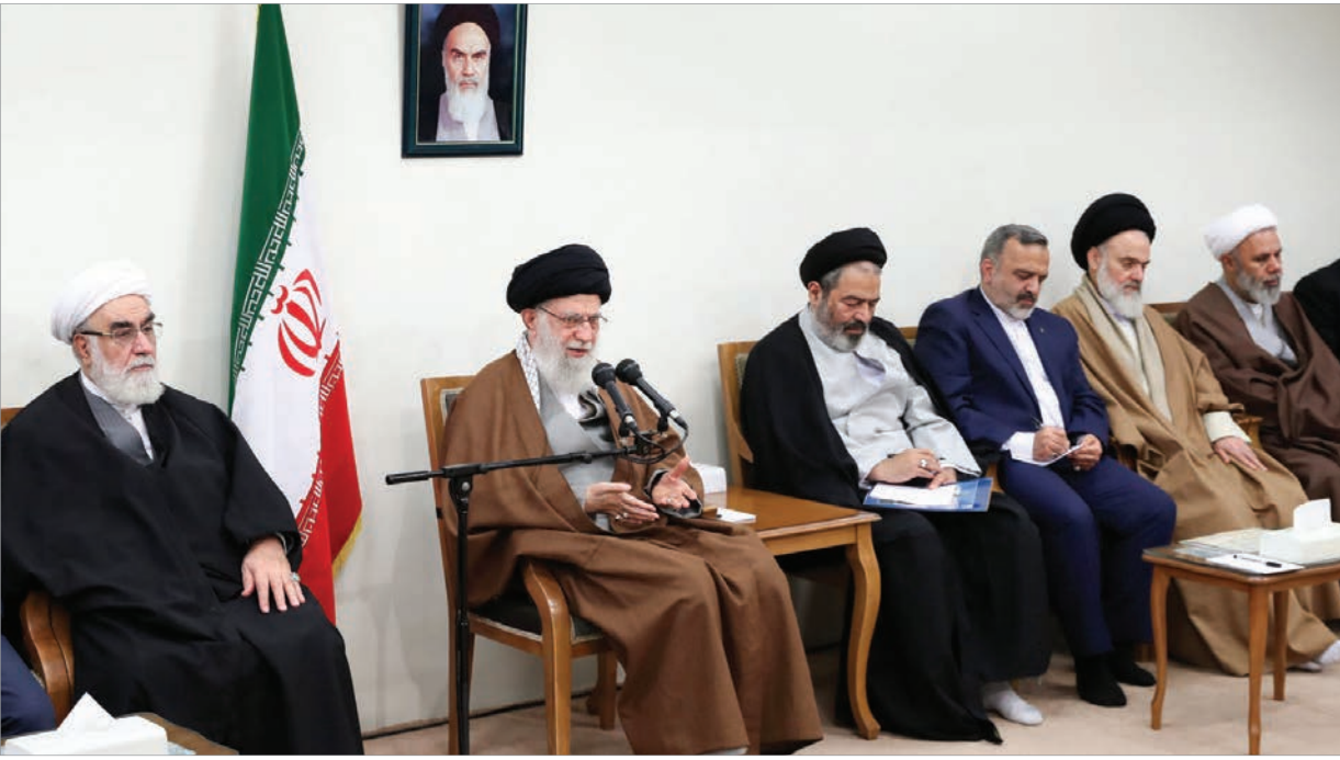
امام خامنه‌ای در دیدار مسئولان حج تأکید کردند

رهبر انقلاب اسلامی منظور آمریکایی‌ها از این حرف را که ایران باید به یک کشور عادی تبدیل شود، دست کشیدن جمهوری اسلامی از آن سخن نو؛ یعنی «تلقیف آراء مردمی با افکار اسلامی و مبانی دینی در تشکیل و اداره جامعه» دانستند و افزودند: الگوی مردم‌سالاری دینی برای دنیا ناشناخته است و در مقابل میلیون‌ها وسیله تبلیغاتی که امروز در حال فعالیت علیه جمهوری اسلامی است، می‌توان از فرصت حج برای تبیین این الگو و مسائلی مانند علت دشمنی آمریکا و منطق زیر بار زور نرفتن ملت ایران استفاده کرد. ایشان، مبانی تفکر اسلامی و تشریح مصادیق آن، از جمله ایستادگی جمهوری اسلامی، را برای دنیا جذاب خواندند و گفتند: علت عصبانیت