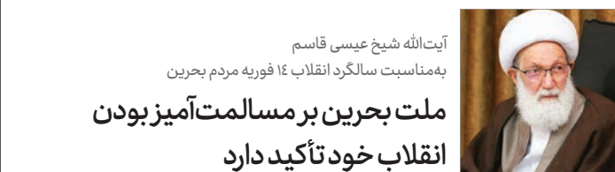
آیت‌الله شیخ عیسی قاسم به مناسبت سالگرد انقلاب ۱۴ فوریه مردم بحرین ملت بحرین بر مسالمت‌آمیز بودن انقلاب خود تأکید دارد

امام خمینی و انقلاب اسلامی هم چون آتش فشانی در برابر استکبار جهانی و جاهلیت نوین بود.