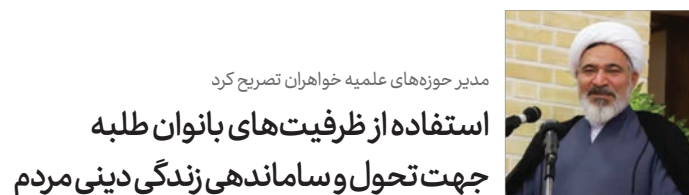
مدیر حوزه‌های علمیه خواهران تصریح کرد استفاده از ظرفیت‌های بانوان طلبه جهت تحول و ساماندهی زندگی دینی مردم

اگر می‌خواهیم در جامعه خانواده‌ها با فرهنگ و منش اهل بیت پیوسته رشد کنند، نیاز به زنان شایسته‌ای داریم که دین را خوب بفهمند.