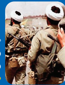
در ۴ صفحه منتشر شد ویژه‌نامه روحانیت و دفاع مقدس به مناسبت اول اسفند

آیت‌الله غروی عضو شورای عالی حوزه‌های علمیه تصریح کرد