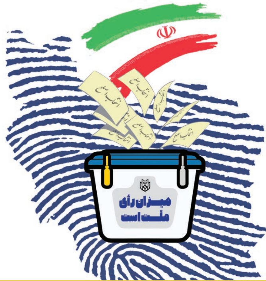
آیت‌الله العظمی نوری همدانی تأکید کردند

مردم به کاندیداهای متدین، متعهد و دارای سوابق انقلابی رأی دهند