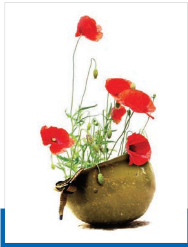
تهیه وتنظیم:علی‌اکبر بخشی

سرانجام در سال ۱۳۶۳ و همزمان با تولد حضرت زهرا علیه «در عملیات بدر» منطقه شرق رودخانه دجله با اصابت ترکش‌ها قامت بلندش خمید و چشم حق بین به محفل ملکوتیان گشود. جسد مطهر شهید پس از سال‌ها انتظار، در سال ۱۳۷۴ در گلستان شهدای میانه به خانه ابدی سپرده شد.