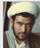
این شماره تقدیم می شود به روح بلند حجت الاسلام رضا مافی

روحانی شهید، رضا مافی در ۱۱ اسفند ماه سال ۱۳۳۸ در یک خانواده متدین و مذهبی در شهرستان سلماس چشم به جهان گشود و بعد از اخذ دیپلم، در سال ۵۷ وارد مدرسه علمیه ولی عصر (عج) تبریز شد و زیر نظر آیت الله بنایی به فراگرفتن علوم دینی مشغول شد. وی در دوران رژیم ستم شاهی به همراه شهید جاویدالانتر، شهید خلیل احمدپور اعلامیه های امام خمینی را در شهرستان سلماس بین مردم پخش می کرد و در ۲۶ دی ماه سال ۵۶ در جریان سرنگونی مجسمه شاه در تبریز، شهید مافی از مهم ترین افراد عامل در این قضیه بود و به همراه مردم این شهر مجسمه پهلوی را به زمین افکند.