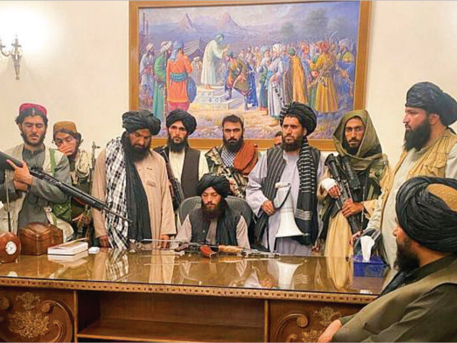
افغان‌العرب در این میان، سهم بزرگی داشت تا بدانجا که