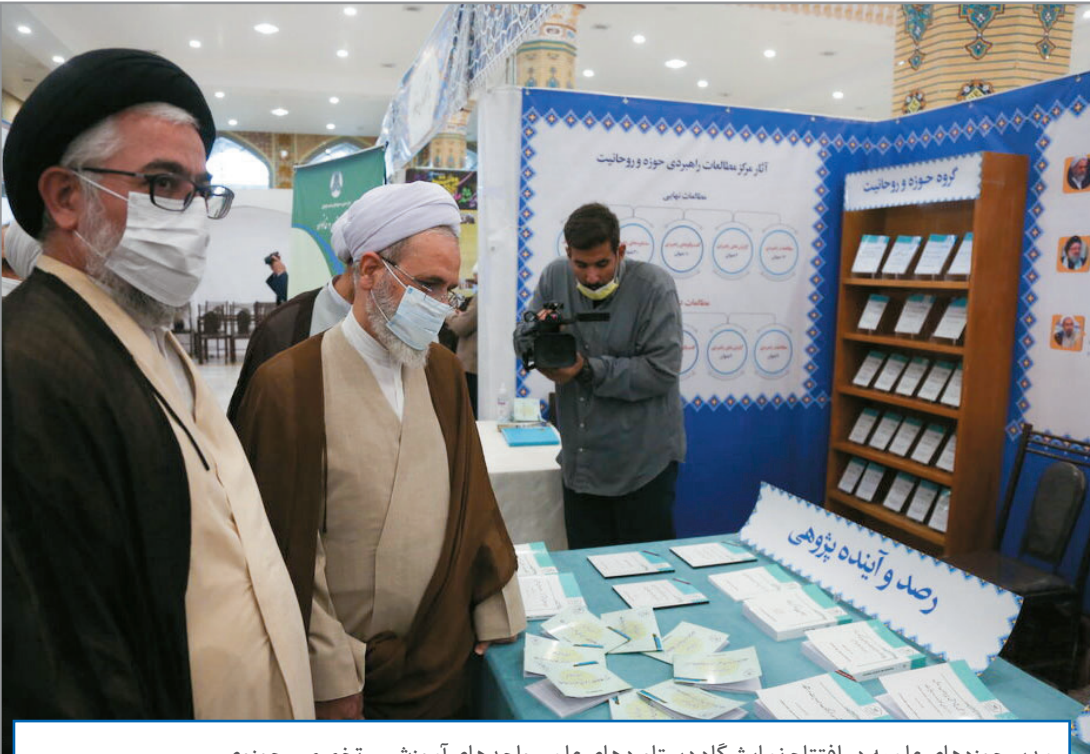
مدیر حوزه‌های علمیه در افتتاح نمایشگاه دستاوردهای علمی واحدهای آموزشی - تخصصی حوزوی