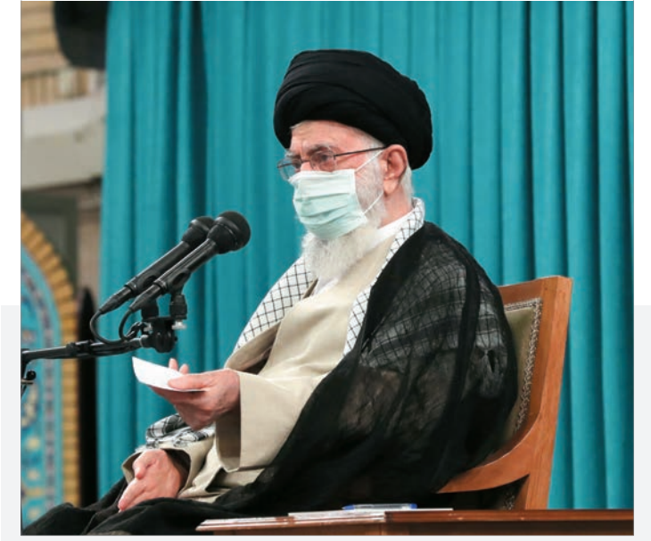
امام خامنه‌ای در دیدار دست‌اندرکاران کنگره شهدای استان زنجان تأکید کردند