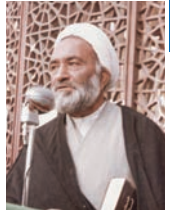
عوامل حرص و طمع