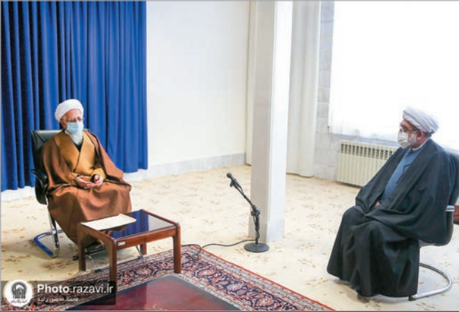
مراجع عظام و علما در دیدار تولیت آستان قدس رضوی تأکید کردند