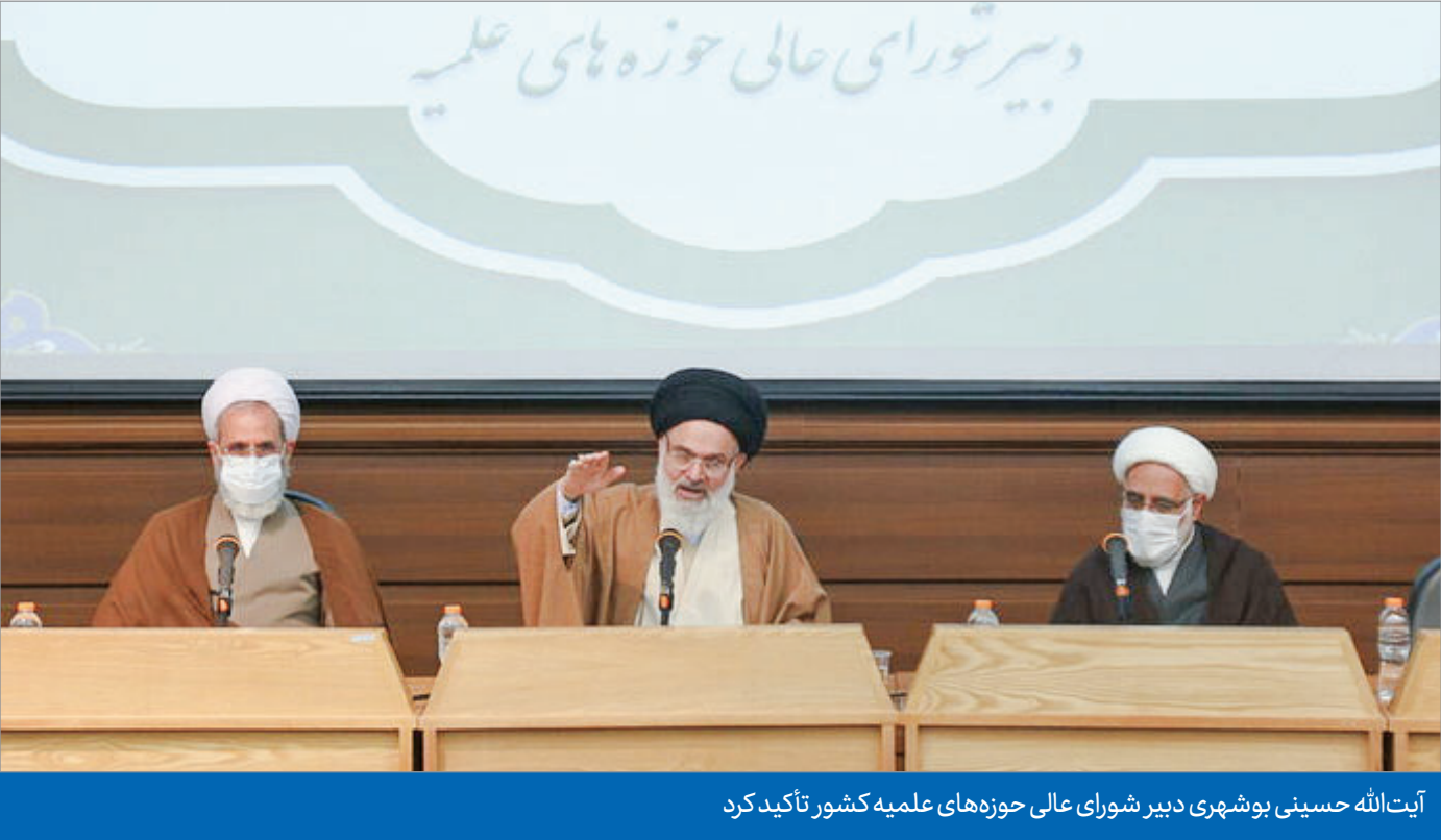
آیت‌الله‌حسینی بوشهری دبیر شورای عالی حوزه‌های علمیه‌کشور تأکید کرد