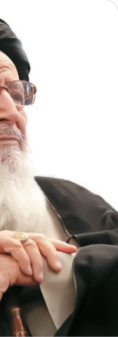
ادامه در صفحه بعد

مقدار پول خرده جمع شده که کفایت نمی‌کند. فکر کردم که باید عملی را انجام دهم تا آن‌ها را بیدار کنم و کمک بیشتری کنند؛ لذا کیسه پول را پرت کردم به طرف مردم و با عصیانیت گفتم: مردم! خجالت نمی‌کشید برای امام حسین ﷺ پول خرده می‌دهید؟ ناگهان زنی بلند شد و گفت: من یک درخت تنومند و خشکیده صدساله گردو دارم که آن را اهدا می‌کنم برای ساخت منبر. همین الان دستور دهید آن را ببرند و بعد مردم پول زیادی جمع‌آوری کردند. بعد از مدتی به ما خبر دادند که منبر ساخته شده است. پیش خودم گفتم باید طوری عمل کنم که این منبر با عظمت به مسجد آورده شود. با هماهنگی، هیأت‌ها را با لباس سیاه و پرچم و علم به مسجد امام حسن ﷺ آوردم و در روز پنجشنبه هیأت‌ها منبری از سمت نجاری مثل تابوت سر دست گرفتند و با نوحه‌خوانی و سینه‌زنی به طرف مسجد امام حسن ﷺ آوردند. بازار تعطیل شده و شوری بپا شد. وقتی منبر را در مسجد گذاشتند، رفتی روی پله اول منبر و بلند گفتم: آمین! رفتی روی پله دوم و بلند گفتم: آمین! روی پله سوم هم بلند گفتم: آمین و ایستاده گفتم: ایها الناس! پیامبر اکرم ﷺ اولین بار که منبرشان در مسجدالنبی ساخته شد و روی پله‌ها می‌رفتند، آمین گفتند. وقتی اصحاب از حضرت سؤال کردند که چرا آمین می‌گویید؟ پیغمبر ﷺ فرمود: جبرئیل دعا کرد و من آمین گفتم و آن‌گاه با خواندن خطبه به مردم گفتم: ای مردم! همت کنید این مسجد ساخته شود. باز همان خانم زمینی را اهدا کردند که با اجازه آیت‌الله‌العظمی بروجردی آن زمین را فروختم و با کمک‌های مردمی مسجد را تجدید بنا کردم.