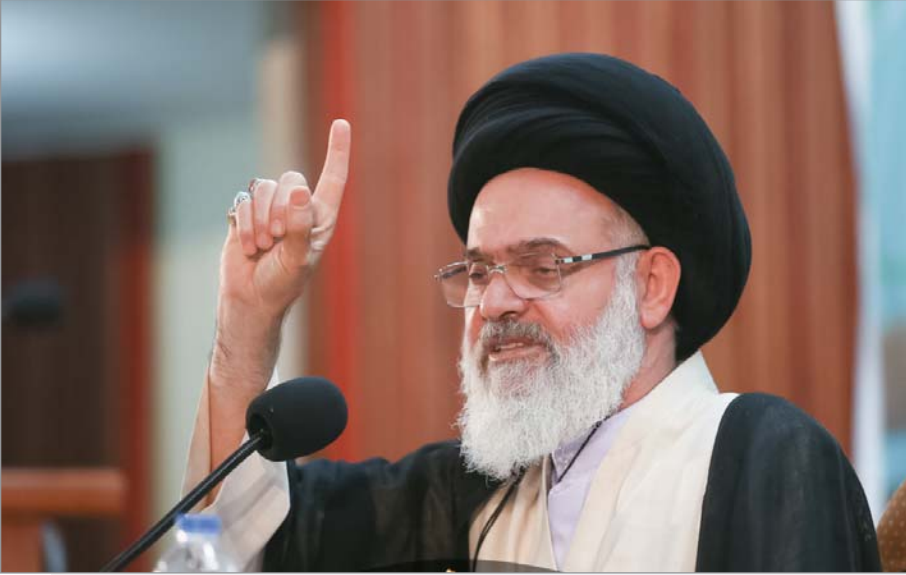
آیت‌الله حسینی بوشهری در اجلاس سالیانه اساتید سطوح عالی و خارج حوزه علمیه قم بررسی کرد