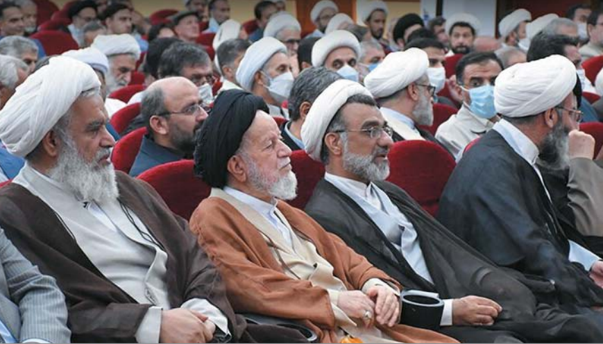
در اختتامیه نخستین دوره تربیت مبلغ زبان‌دان در جامعه الزهرا علیه السلام مطرح شد

تجلیل از آیت‌الله شاهچراغی، تجلیل از مکتب اسلام است؛ زیرا او ۵۰ سال نماز صبح، ظهر و شب را در مسجد عابدینیه به‌عنوان پایگاه سیاسی اسلام اداره کرد و در این مسجد مبارزه کرد و درس داد و برای تحکیم پایه‌های نظام