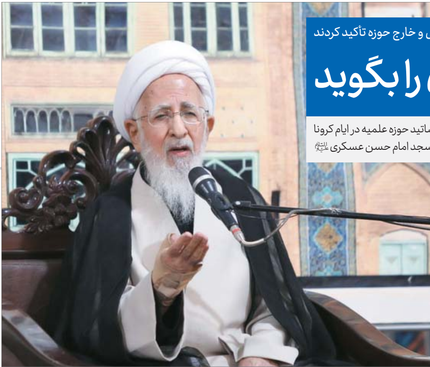
در محضر بهجت، ج، ص ۳۲۸

فرمود: اختلاف است، مخالفت نیست. معنای اختلاف هم آن است که اگر آن یکی رفت، این یکی کار او را انجام می‌دهد. فرمود: « و هو الذی جعل اللیل والنهار خلفة لمن أراد أن یذکر أو أراد شکورا»؛ یعنی اگر گفتیم: «و اختلاف اللیل والنهار» لیل، خلیفه نهار و نهار خلیفه لیل است. اگر عبادت‌ها و خدمات در شب انجام نشد، در روز انجام می‌گیرد و بالعکس. این اختلاف به خلیفه برمی‌گردد؛ نه به مخالفت. پس اگر اختلافی بین لیل و نهار است، یعنی دیگری کار او را انجام می‌دهد؛ اما مبادا خدای ناکرده اختلاف با مخالفت خلط بشود.