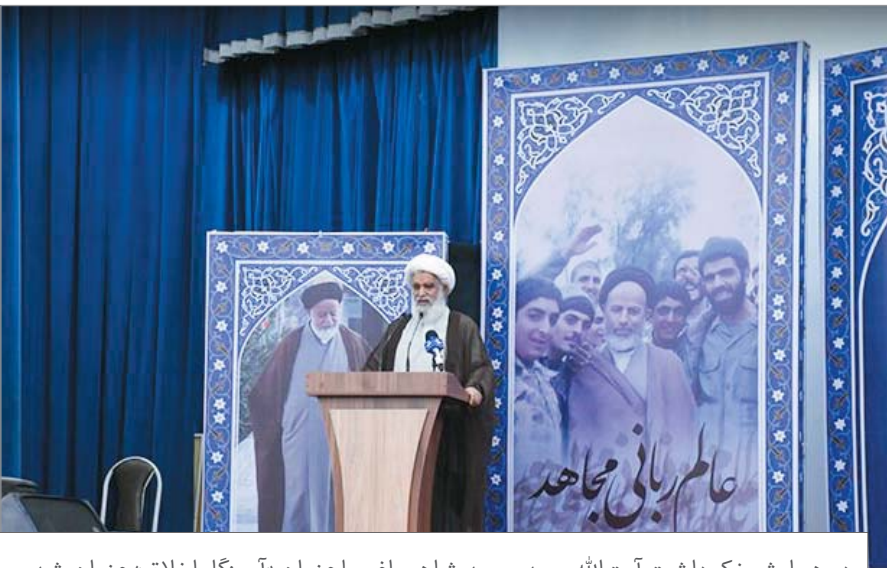
در همایش نکوداشت آیت‌الله سیدمحمد شاهچراغی با عنوان «آموزگار اخلاق» عنوان شد

حجت‌الاسلام والمسلمین سیدمحمود دعائی، در جریان مبارزات انقلابی، در سال ۱۳۴۶ تحت تعقیب رژیم شاه قرار گرفت و مخفیانه به عراق رفت. در این دوران تلاش‌های وسیعی جهت استردادش از سوی مأموران رژیم گذشته صورت گرفت؛ ولی موفق نشدند. وی از اعضای مجمع روحانیون مبارز، سرپرست مؤسسه اطلاعات از سال ۱۳۵۹ تا پایان حیات خویش و نماینده شش دوره مجلس شورای اسلامی بوده است. حجت‌الاسلام والمسلمین دعائی از همراهان امام خمینی علیه السلام در دوران اقامت در نجف اشرف بوده و در فاصله سال‌های ۱۳۵۷ تا ۱۳۵۹، نیز، سفیر ایران در عراق بود.