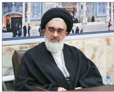
امر به معروف و نهی از منکر، منحصر به جوامع اسلامی نیست.

قم - ناصر مکارم شیرازی ۷ مردادماه ۱۴۰۱ش/ ۲۹ ذی‌الحجه ۱۴۴۳ق