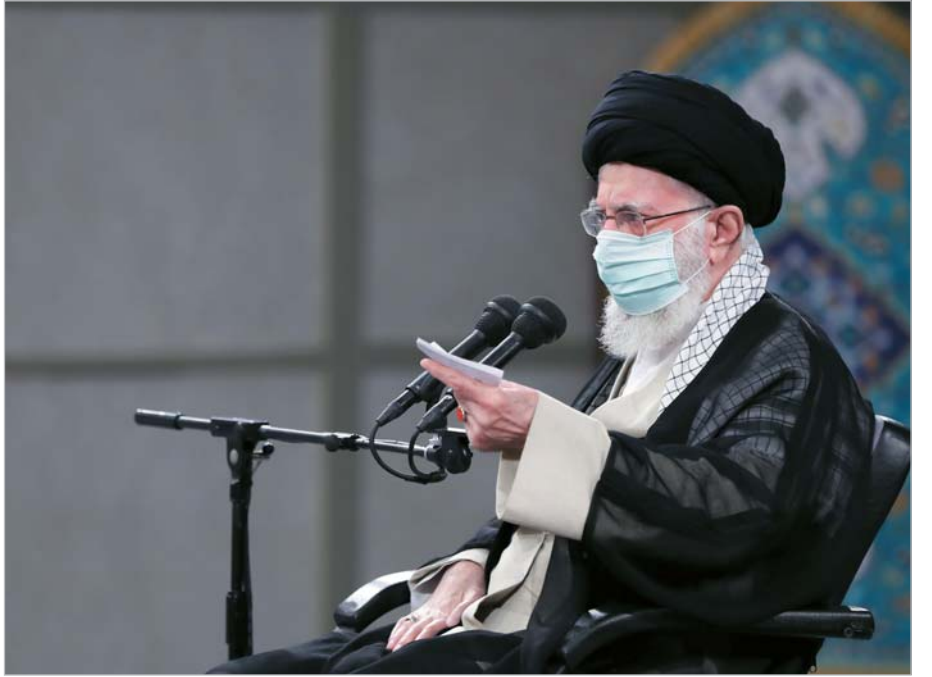
تأکید امام خامنه‌ای در دیدار ائمه جمعه