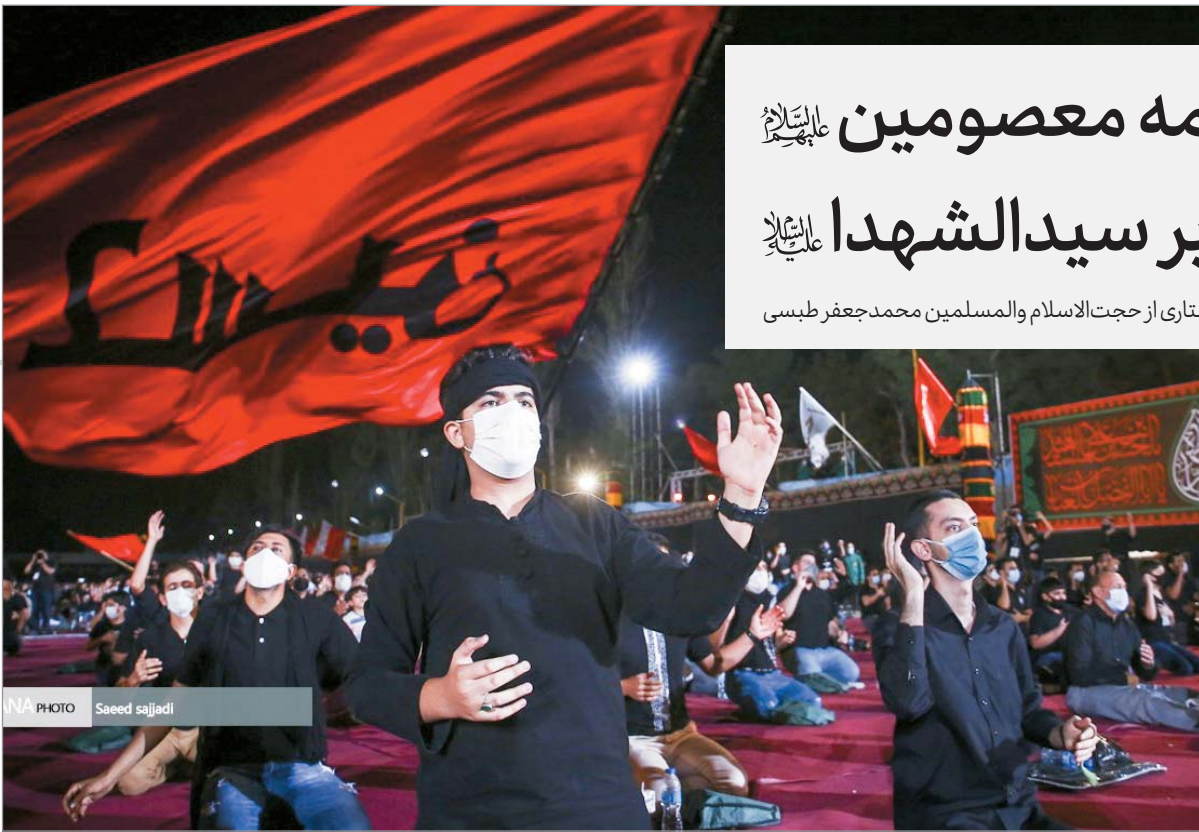
شرح مکاتیب عارفان، ص ۷۲

هیچ غذایی مقابل آن حضرت گذارده نشد؛ مگر اینکه برای امام حسین علیه‌السلام گریه می‌کرد...؟» (بکی علی بن الحسین علیه‌السلام علی‌آبیه...کامل‌الزیارات، ص ۱۰۷)