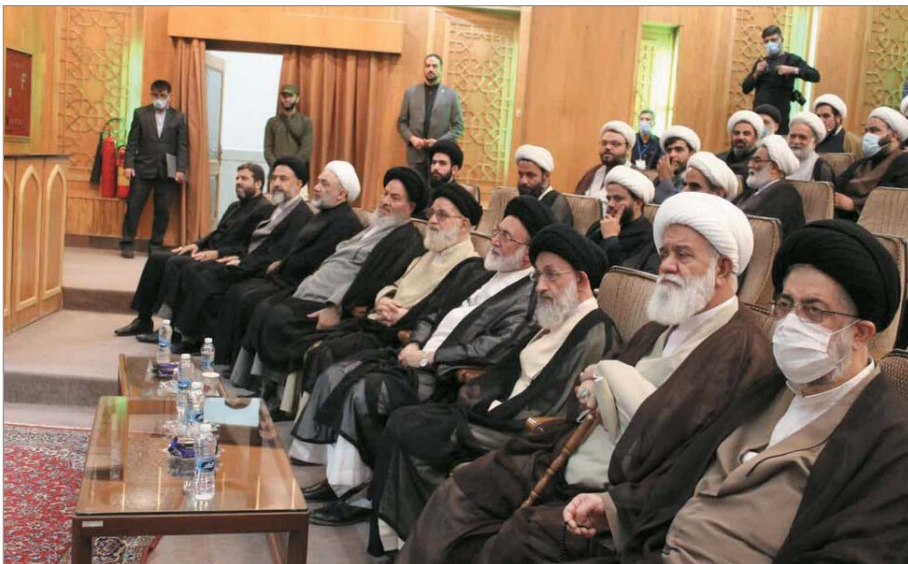
آیت‌الله‌العظمی نوری همدانی در محضر نور

امروز بر علما لازم است در کنار مردم و با مردم باشند؛ عالمی که از مردم جدا باشد نمی‌تواند مؤثر قرار بگیرد. روحانیت باید خود را از مردم جدا نکند.