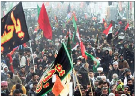
گزارش: سیدامیر سجادی

وی افزود: کار در حوزه اربعین، سراسر فرهنگی و تبلیغی است؛ بنابراین سعی کرده‌ایم جلوه‌های کار فرهنگی را با حضور مبلغان روحانی تقویت کنیم و بر این اساس، ادارات کل اوقاف استان‌ها موظف شده‌اند، علاوه بر پذیرایی از زائران، اقلام فرهنگی را برای توزیع بین کودکان و نوجوانان و دیگر گروه‌های سنی فراهم کنند.