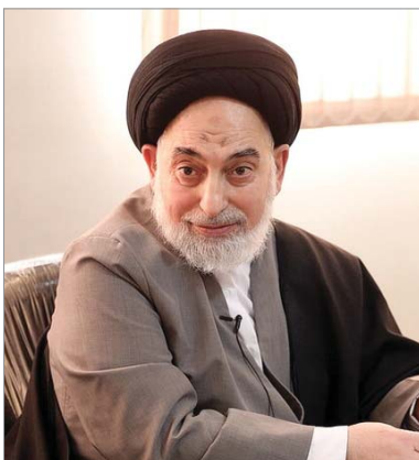
امام جمعه نجف‌اشرف

رئیس‌جمهور از «امید و امیدآفرینی» از دیگر آموزه‌های اهل‌بیت علیهم‌السلام دانست و گفت: امروز هرکس در هر کجای عالم دچار یأس و ناامیدی شده، می‌تواند با تمسک به آموزه‌های اهل‌بیت علیهم‌السلام امیدوار شود.