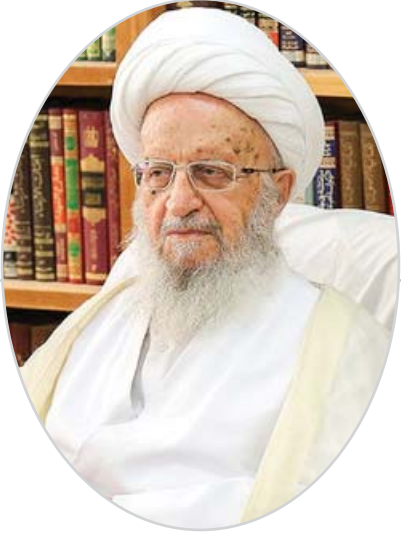
تأکید مراجع عظام تقلید در دیدار وزیر صمت

صنعت، معدن و تجارت، این وزارتخانه را با سایر وزارتخانه‌ها بسیار متمایز دانستند و بر همین اساس، به‌کارگیری نیروهای متعهد مؤمن و پاکدست را در پست‌های این وزارتخانه بسیار ضروری عنوان و خاطر نشان کردند: باید مراقب بود که افرادی که شایستگی ندارند، در پست‌های حساس این وزارتخانه که وظیفه تولید و صنعت کشور را بر عهده دارد، به‌کارگیری نشوند.