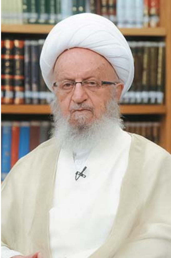
آیت‌الله‌العظمی مکارم شیرازی