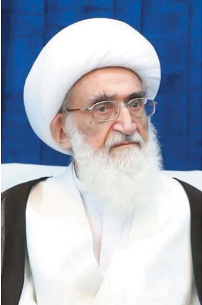
آیت‌الله‌العظمی نوری همدانی