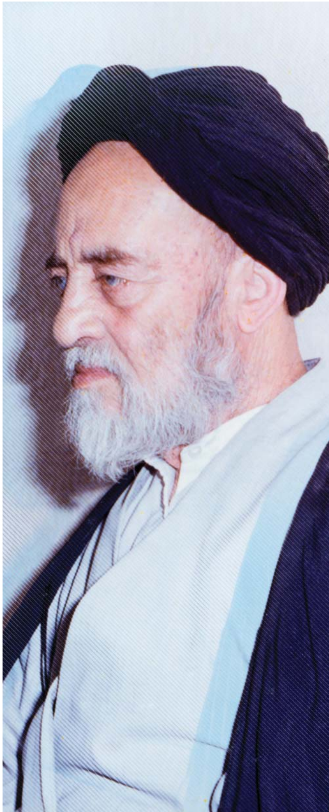
آیت‌الله‌العظمی مکارم شیرازی