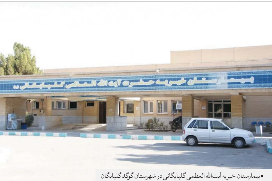
■ بیمارستان خیریه آیت الله العظمی گلپایگانی در شهرستان گرگد گلپایگان