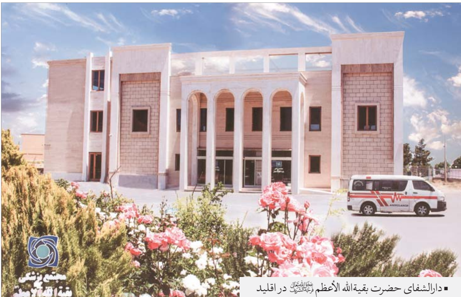
■ دارالشفای حضرت بقیة الله الأعظم رحمته الله علیه در اقلید