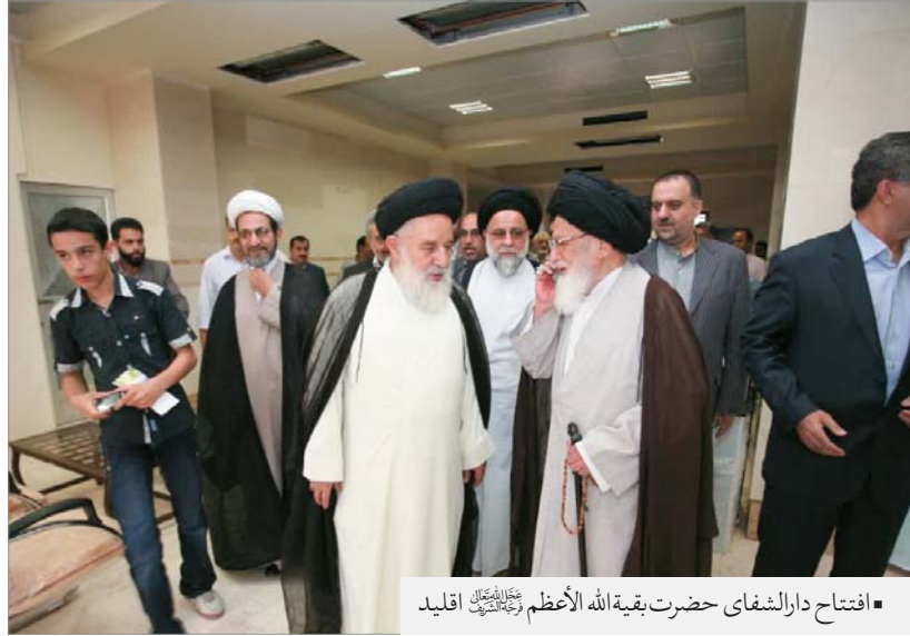
■ افتتاح دارالشفای حضرت بقیة الله الأعظم رحمته الله علیه اقلید

مردم اقلید در سال ۱۳۶۹ شمسی هشتاد هزار متر زمین را به آیت الله العظمی گلپایگانی رحمته الله علیه اهدا نمودند که پنجاه هزار متر آن زمین، بنا به درخواست وزیر وقت مسکن و شهرسازی و به دستور آیت الله العظمی گلپایگانی رحمته الله علیه ، تحت اشراف آیت الله حاج سید محمدباقر موحد ابطحی رحمته الله علیه برای احداث بیمارستان مجهزی در ۱۴ بخش و در بهترین نقطه شهر اقلید اختصاص یافت. دولت وقت اصرار بر آن داشت که بیمارستان را به نام آن مرجع کبیر مزین نماید که معظم له مخالفت کردند و گفتند: «بیمارستان را به نام نامی حضرت ولی عصر علیه السلام نام گذاری کنید» و از این طریق، مردم را به حضرت حجت ارواحنا فداء سوق دادند.