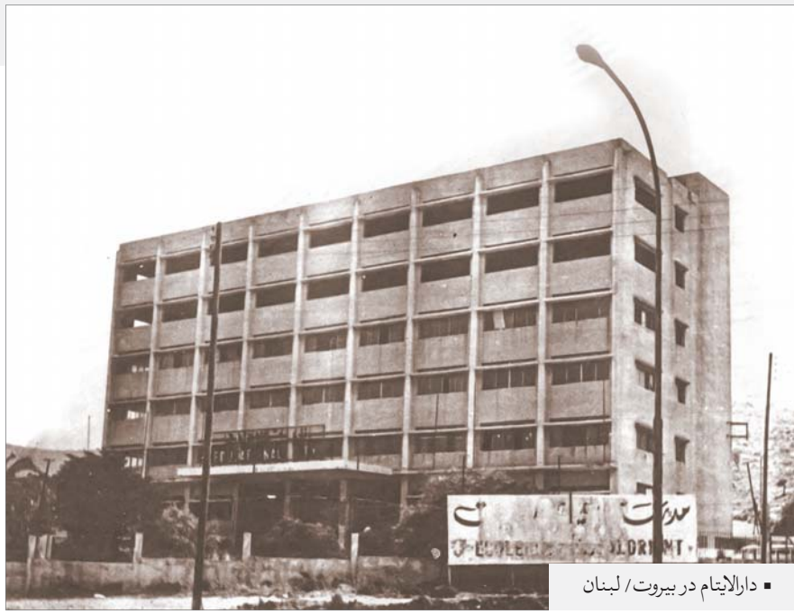
دارالایتام در بیروت / لبنان

تأسیس یک مسجد و مرکز بزرگ فرهنگی در کنار