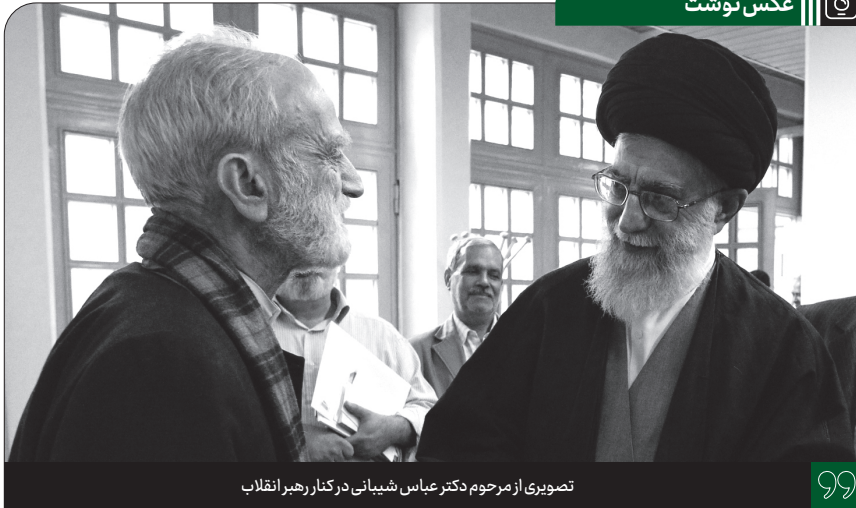
تصویری از مرحوم دکتر عباس شیبانی در کنار رهبر انقلاب