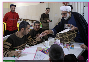
حضور تولیت آستان قدس رضوی در آسایشگاه شهید بهشتی مشهد