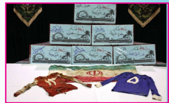
کشف پیراهن استقلال و پرسپولیس در تفحص شهدا