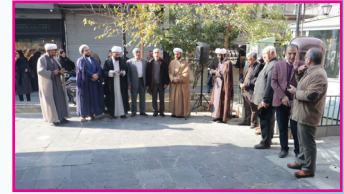
روحانیون همدانی پای درد دل‌های بازاریان نشستند