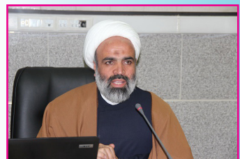
تغییرات در سازمان بسیج اساتید، طلاب و روحانیون کشور