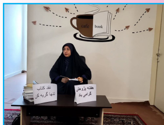
کتاب 'تنها گریه کن' نقد و بررسی شد