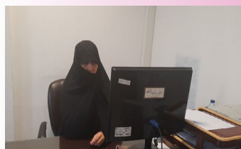
وضعیت پژوهشی حوزه علمیه خواهران استان مرکزی تشریح شد