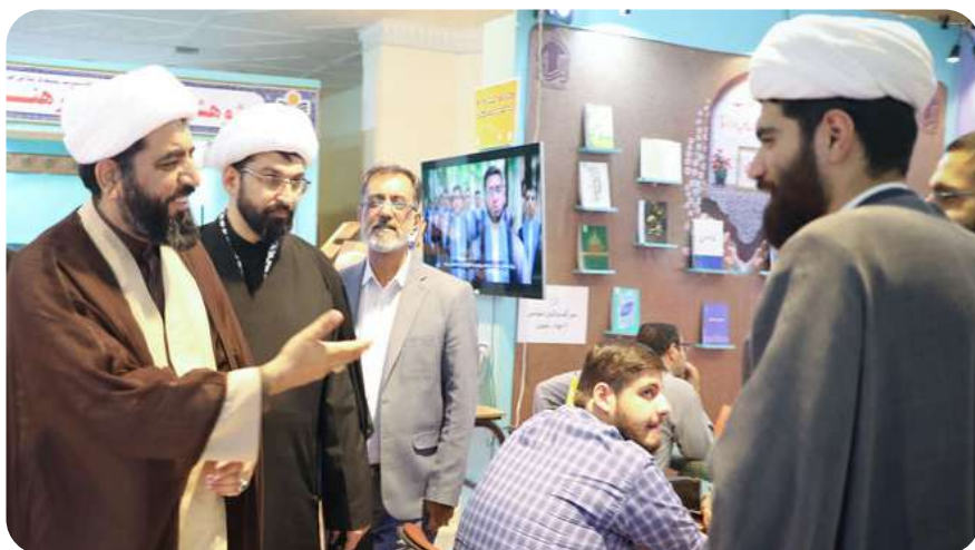
بازدید مسئول مرکز رسانه و فضای مجازی حوزه های علمیه از نمایشگاه قرآن