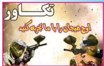
حوزه علمیه ای که باشگاه پینت بال دارد

برای مشاهده مستند آقای امام جمعه کلیک کنید.