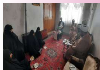
تقدیر مدیر حوزه علمیه خواهران استان مرکزی از خانواده شهید مشایخی