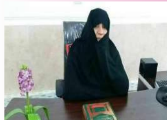
آغاز فعالیت سطح چهار مدرسه علمیه تخصصی فاطمه معصومه (س) بندرعباس