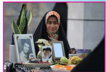
دانش‌آموزان در رویداد «فرشته جان ایران» میزبان خانواده شهدا شدند

چندی قبل برای تولید مستند «یک روز با آقای امام جمعه» به اتفاق همکاران راهی دیار تبریز شدیم. از مردمی بودن و مردمداری حجت الاسلام و المسلمین آل‌هاشم امام جمعه تبریز و ارتباط نزدیک او با اقشار مختلف اعم از بازاری، جوانان، دانشجویان، طلاب، دانش آموزان و خلاصه در یک کلام همه آحاد مردم بسیار شنیده بودم و دوست داشتم که از نزدیک هم این سلوک مردمی را بینم و بپرسم که این همه محبوبیت از کجا آمده است؟ در بدو ورود به تبریز و دفتر آقای امام جمعه با استقبال گرم و صمیمی روبرو شدیم. قرار شد پس از استراحتی کوتاه با حاج آقای آل‌هاشم هم دیداری داشته باشیم و برنامه‌های ضبط مستند را با او هماهنگ کنیم. وعده دیدار فرا رسید و به دیدار حاجی رفتیم، در همان ابتدا با چنان صمیمیتی به استقبالمان آمد که انگار سالهاست ما را می‌شناسد. گرمای محبتش و لحن دلنشینش جذاب بود و معلوم بود آنچه درباره مردمی بودنش شنیده بودیم، واقعیت داشت.