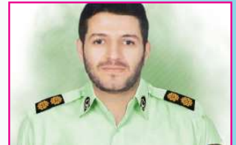
پیکر شهید مدافع امنیت در بندرعباس تشییع شد

چندی قبل برای تولید مستند «یک روز با آقای امام جمعه» به اتفاق همکاران راهی دیار تبریز شدیم. از مردمی بودن و مردمداری حجت الاسلام و المسلمین آل‌هاشم امام جمعه تبریز و ارتباط نزدیک او با اقشار مختلف اعم از بازاری، جوانان، دانشجویان، طلاب، دانش آموزان و خلاصه در یک کلام همه آحاد مردم بسیار شنیده بودم و دوست داشتم که از نزدیک هم این سلوک مردمی را بینم و بپرسم که این همه محبوبیت از کجا آمده است؟ در بدو ورود به تبریز و دفتر آقای امام جمعه با استقبال گرم و صمیمی روبرو شدیم. قرار شد پس از استراحتی کوتاه با حاج آقای آل‌هاشم هم دیداری داشته باشیم و برنامه‌های ضبط مستند را با او هماهنگ کنیم. وعده دیدار فرا رسید و به دیدار حاجی رفتیم، در همان ابتدا با چنان صمیمیتی به استقبالمان آمد که انگار سالهاست ما را می‌شناسد. گرمای محبتش و لحن دلنشینش جذاب بود و معلوم بود آنچه درباره مردمی بودنش شنیده بودیم، واقعیت داشت.