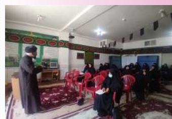
برگزاری دوره آموزشی مبلغین در مدرسه علمیه الزهرا (س) فریدن