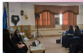
بانوان طلبه محلات با آثار دفاع مقدس آشنا شدند