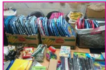
توزیع لوازم التحریر بین دانش آموزان نیازمند بوشهری