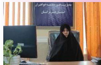
گزارشی از فعالیت دبستان بشارت وابسته به حوزه علمیه خواهران هرمزگان