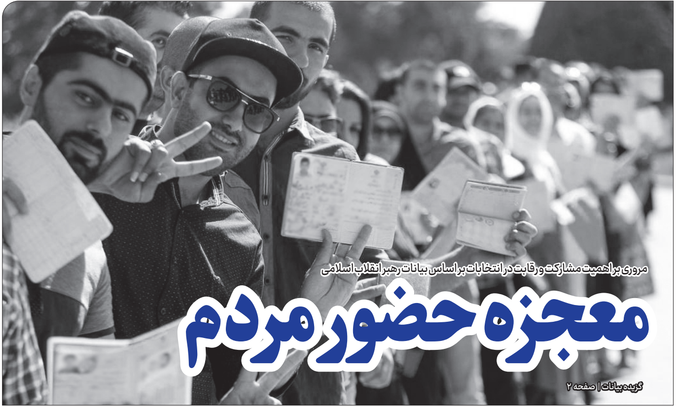
مروری بر اهمیت مشارکت و رقابت در انتخابات پر اساس بیانات رهبر انقلاب اسلامی