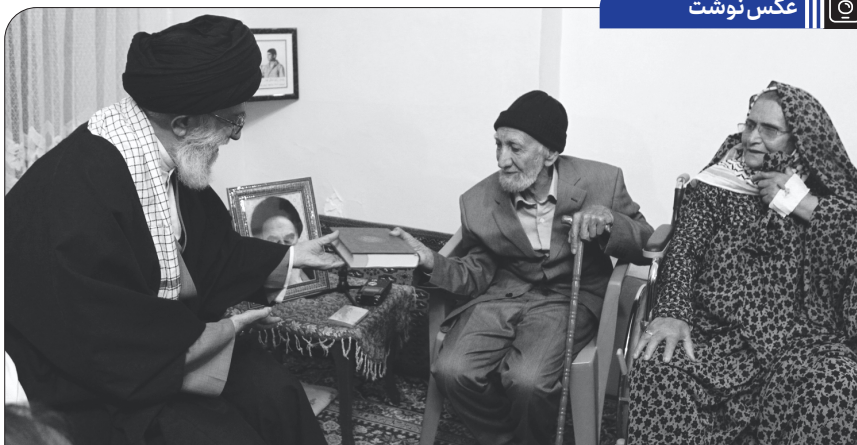
حضور رهبر انقلاب در منزل خانواده شهید در بجنورد، ۱۳۹۱/۷/۲۰