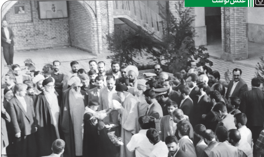
حضور رهبر انقلاب و سخنرانی در گلزار شهدای هویزه، ۱۳۷۵/۱۲/۲۰