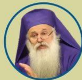
اسقف مالخاز سونگولاشویلی اسقف اعظم بابتیست گرجستان

📍 آدرس حضوری: قم، صفائیه کوچه ۳۷ مدرسه باقر العلوم علیه السلام سالن کنفرانس