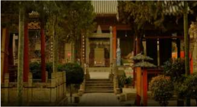
مسجد هواجو در شهر شی آن، تاریخ ساخت: ۱۶۴ هجری قمری / ۷۴۲ میلادی

آموزش و پرورش اسلامی در چین، کمک به توسعه اقتصادی و اجتماعی، حفظ هماهنگی، مذهبی وحدت، قومی ثبات، اجتماعی، اتحاد مجدد سرزمین مادری و صلح جهانی کمک به تحقق رؤیای چینی از جوان سازی بزرگ ملت چین.