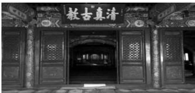
مسجد نیوجه در پکن