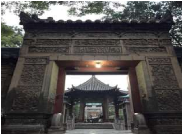
مسجد هواجو در شهر شی آن

۱۳. شرکت در گفتگوها، مبادلات و همکاری با سازمان‌های مذهبی در داخل و خارج از کشور.