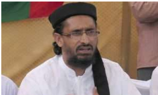
اورنگزیب دبیرکل سپاه صحابه پاکستان

آن اعظم طارق به ریاست این حزب رسید که در سال ۲۰۰۳ در اسلام آباد کشته شد.