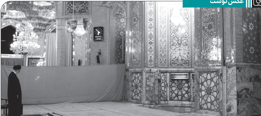
اقامه نماز حضرت آیت الله خامنه ای در مسجد جمکران، ۱۳۸۹/۸/۱