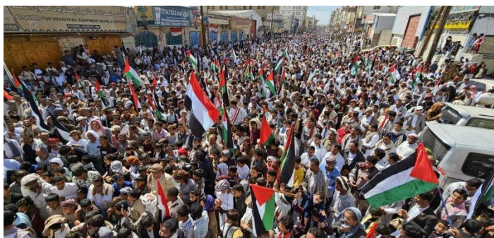
من المظاهرات البسيطة في العاصمه صغده للتنديد بالحرب الاسرائيلية على غزة والنصائح مع الشعب الفلسطيني، 10 نوفمبر 2023

جنگ در نوار غزه نقطه عطفی در تاریخ گروه‌های اسلام سیاسی بود و با توجه به اینکه عملیات جنبش حماس در ۷ اکتبر ۲۰۲۳ عامل اصلی حملات علیه نوار غزه بود، بازتاب‌های بلندمدتی بر آنها خواهد داشت.