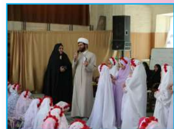
جشن تکلیف دانش آموزان دختر در مسجد حاجی خان ارومیه