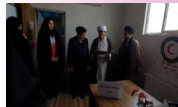
افتتاحیه کانون هلال احمر مدرسه علمیه هاجر خمین