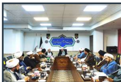
نشست هم‌اندیشی معاون امور طلاب حوزه و مسئولین نهادهای حوزوی یزد