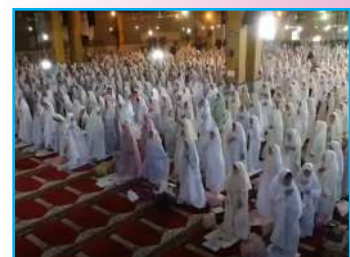
جشن تکلیف دختران دانش آموز دورودی