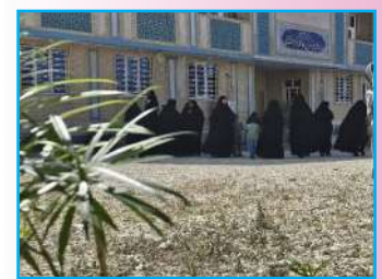
اجرای «پوش ایران بهشت» در مدرسه علمیه فاطمه الزهرا سلام الله علیها کنگان