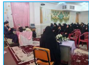
کرسی آزاداندیشی مدرسه علمیه الزهرا (س) فریدن