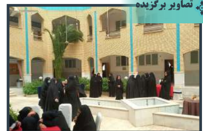
بازدید دانش‌آموزان دوره متوسطه از حوزه علمیه فاطمه الزهرا (س) سازه