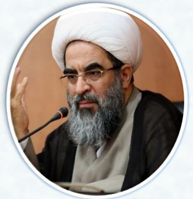
به نقل از وب سایت حوزه نیوز

من به او گفتم سرّ هدایت شما همین است، تو از خلق خدا دستگیری کردی، خدا هم از تو دستگیری کرده است.