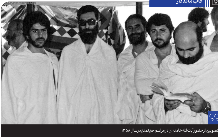
تصویری از حضور آیت الله خامنه‌ای در مراسم حج تمتع در سال ۱۳۵۸