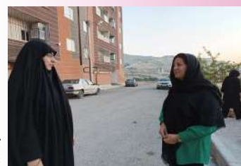
فعالیت خواهران طلبه در تبلیغ جذب طلبه و مشارکت حداکثری در انتخابات