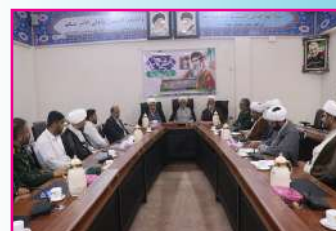
جلسه تجلیل از دست اندرکاران اردوی راهیان پیشرفت حوزه‌های علمیه کشور

متن پرسش و پاسخ خبرنگار صداوسیما با رهبر انقلاب اسلامی پس از حضور در انتخابات ریاست جمهوری چهاردهم