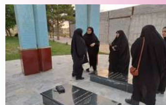
رزمایش کاروان جهاد تبیین حوزه علمیه خواهران مدرسه ولی عصر(ع) گرمی