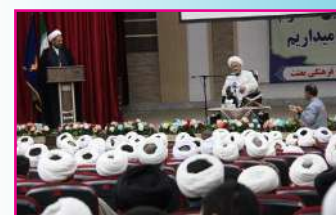
همایش «گفتمان امامین انقلاب در موضوع انتخابات و تبیین نقش انقلابی مردم» در کرمانشاه