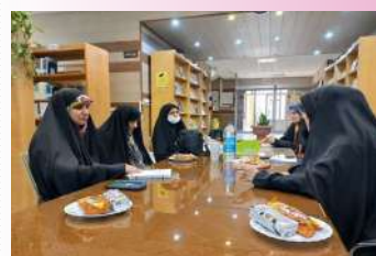
برگزاری نشست کتابخوان پیرامون اربعین شهدای خدمت در ساوه