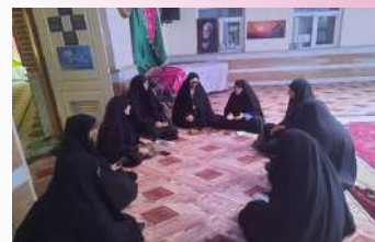
نشست برنامه ریزی تبلیغی انتخابات در بین خواهران طلبه دورودی