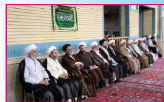
تجلیل از طلاب، اساتید و مبلغان برتر شاهرود