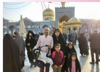
در خانواده‌های دارای چند فرزند، نشاط بچه‌ها بیشتر است