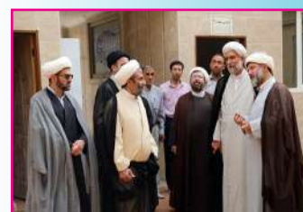
بازدید مسئول دبیرخانه شورای عالی حوزه‌های علمیه از مدرسه علمیه حضرت امیرالمؤمنین علی (ع) دیباج