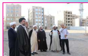
بازدید مسئول دبیرخانه شورای عالی حوزه‌های علمیه از پروژه‌های عمرانی حوزه علمیه استان سمنان