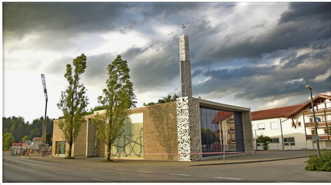
مسجد پنزبرگ Penzberg Mosque

یکی دیگر از مساجد مدرن «مسجد پنزبرگ» آلمان است. جامعه کوچک مسلمانان باواریا این مسجد را با سبک طراحی معاصر ساخته است. مسجد پنزبرگ اتاق هایی برای نماز و معاشرت و فضاهایی اداری دارد. یکی از مهمترین مصالح به کاررفته در این مسجد شیشه به خصوص شیشه آبی است. معماران قصد داشتند با این ایده حس شفافیت و مهمان نوازی را القا کنند. به دلیل معماری خاص این مسجد بازدیدکنندگان غیر مسلمان نیز از آن بازدید می کنند.