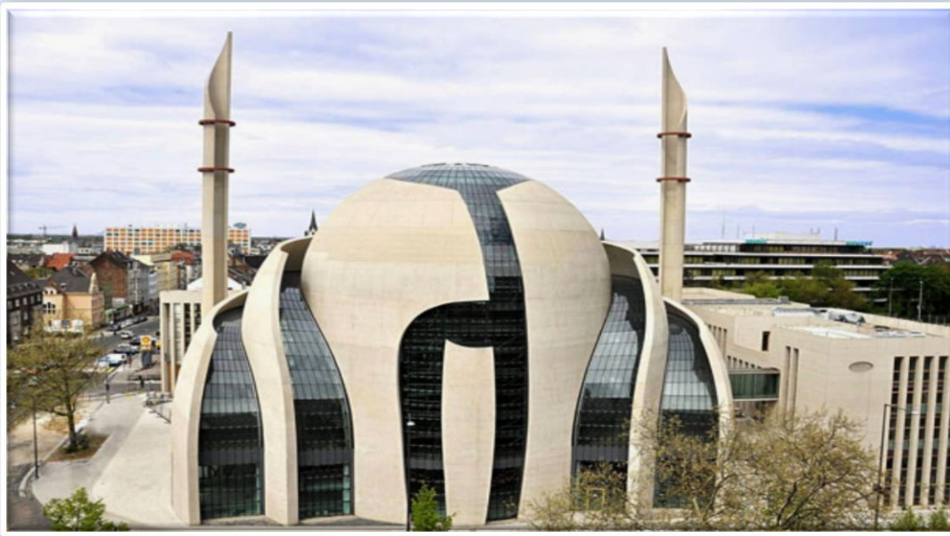
مسجد مرکزی کلن Cologne Central Mosque

«مسجد مرکزی کلن» بزرگ ترین مسجد آلمان و یکی از بزرگ ترین مساجد اروپا است. مسجد مرکزی کلن گنجایش ۲۰۰۰ تا ۴۰۰۰ نمازگزار را دارد. معماران این مسجد گاتفرید بوم و پسرش هستند که در ساختن کلیسا تخصص دارند. گنبد مسجد از بتن و شیشه ساخته شده و ارتفاع مناره آن ۵۵ متر است، دیوارهای مسجد هم از شیشه ساخته شده. در طبقه همکف این مسجد یک بازار و در زیر زمین آن سالن اجتماعات واقع شده اند و شبستان مسجد و کتابخانه در طبقه اول.