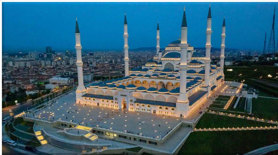
مسجد چاملیجا Camlica Mosque

یکی دیگر از مساجد مدرن «مسجد پنزبرگ» آلمان است. جامعه کوچک مسلمانان باواریا این مسجد را با سبک طراحی معاصر ساخته است. مسجد پنزبرگ اتاق هایی برای نماز و معاشرت و فضاهایی اداری دارد. یکی از مهمترین مصالح به کاررفته در این مسجد شیشه به خصوص شیشه آبی است. معماران قصد داشتند با این ایده حس شفافیت و مهمان نوازی را القا کنند. به دلیل معماری خاص این مسجد بازدیدکنندگان غیر مسلمان نیز از آن بازدید می کنند.