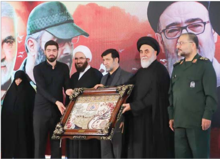
در آیین ملی تکریم فعالان مساجد عنوان شد