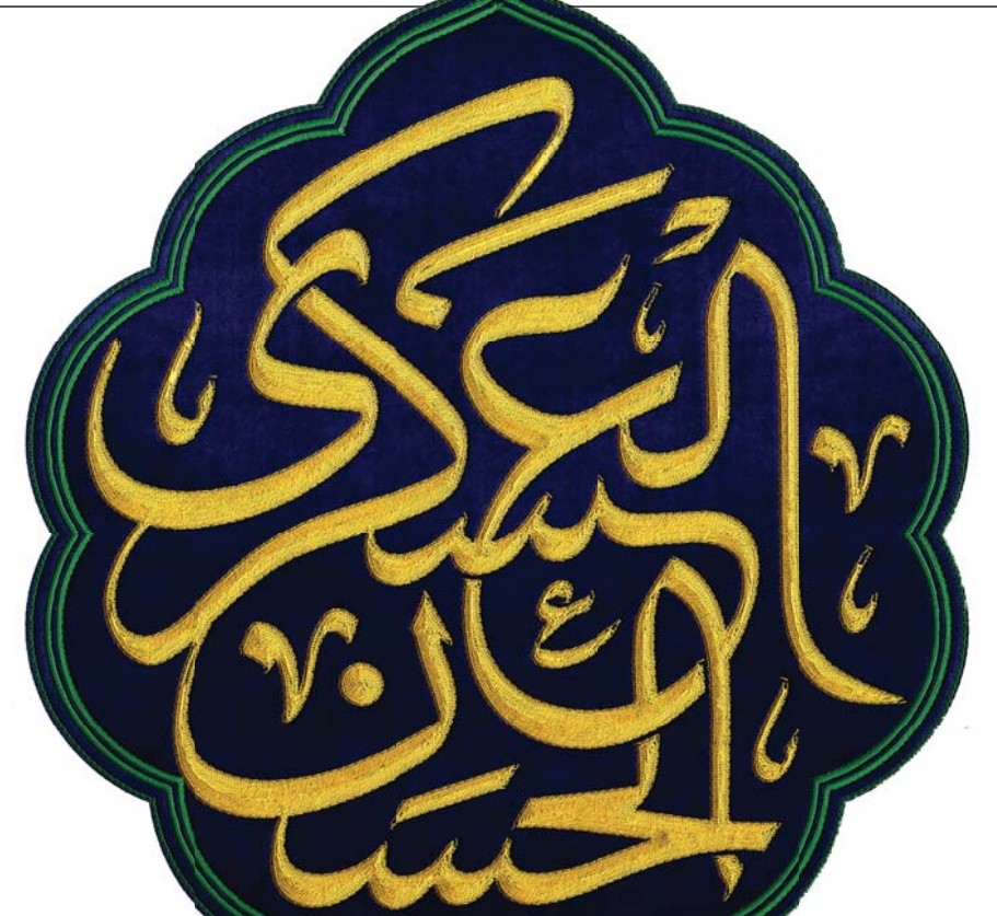
موسوعه الإمام العسکری، ج ۳،ص ۳۱۸

کسی که پارسایی جزء سرشت او و جود و سخاوت جزء طبیعت او و بردباری دوست او گردد دوستانش و تعریف او زیاد خواهد شد و از دشمنانش با ستایش کردن بر او انتقام می‌گیرد.