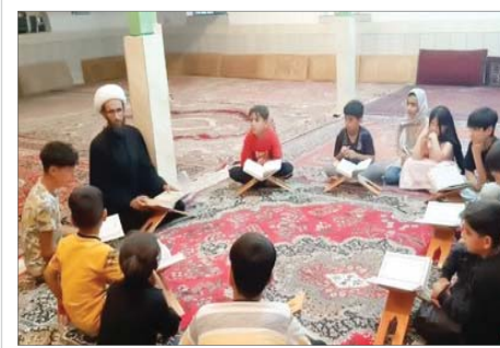
گزارش: رحیم کریمی

رئیس شورای سیاست‌گذاری ائمه جمعه، حضور در اجتماع مؤمنین و درخشش اجتماعی را از پایگاه مساجد دانست و با اشاره به شعار «حب المسجد یجمعنا»، گفت: این یک بنیان و اساس قرآنی است که بدانیم، اگر کم و کسری در فرآیندهای تربیتی جامعه داریم و احساس می‌کنیم، باید ببینیم مساجد ما در راستای نقش پرورشی و تربیتی خاص خودشان فعال هستند. انسان مؤمن و مجاهد و تراز که اساس تمام تحولات محسوب می‌شود، باید در مسجد تربیت شود.