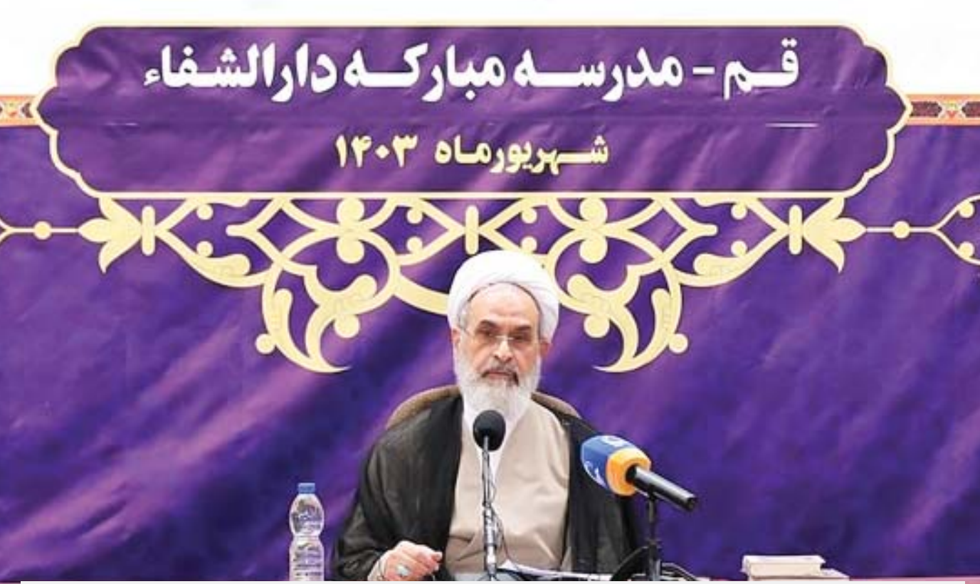
آیت‌الله اعرافی در مراسم افتتاحیه آغاز سال تحصیلی حوزه‌های علمیه

مدیر حوزه‌های علمیه، با بیان اینکه برای فقه معاصر و تمام‌خوانی، رفت و آمد به مرکز حوزه، نخبگان و برجستگان حوزوی و نیز هدفمندی خدمات اقدامات و امتیازات و نیز برنامه‌های تبلیغ ویژه‌ای لحاظ شده است، خاطرنشان کرد: طرح جامع تبلیغ در طول یک‌سال، از فرمایشات رهبر معظم انقلاب تهیه شده است و نیز دبیرخانه کانون‌های تبلیغ راه‌اندازی شده و ان‌شاء‌الله بتوانیم، در همه زمینه‌ها با قوت و قدرت به پیش برویم.