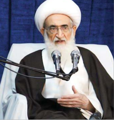
آیت‌الله‌العظمی نوری همدانی

معظّم‌له افزودند: بعد از انقلاب اسلامی، وظیفه روحانیت بیشتر شد؛ لذا باید همه‌چیز در خدمت دین و دنیای مردم باشد.