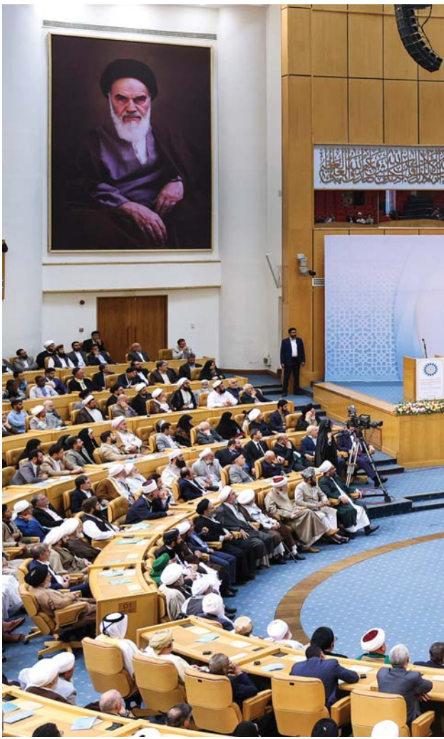
ادامه از صفحه قبل