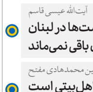
آیت‌الله عیسی قاسم

روحانیت از مراجع عظام تا طلبه‌ها در دوران دفاع مقدس بسیار سرفراز است؛ زیرا هم به‌عنوان تبلیغی و هم، رزمی تبلیغی ایفای نقش کرده است.