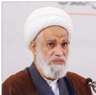
آیت‌الله کعبی در همایش ۱۵۰ جماعات مساجد استان قم

غریبی‌ها فکر می‌کنند، فقط خودشان همه چیز می‌فهمند؛ درحالی‌که تولیدات علمی قم، از هر دانشگاه دنیا بیشتر است.