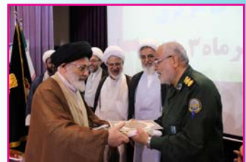
تجلیل و تکریم از روحانیون آزاده و ایثارگر دوران دفاع مقدس در اراک