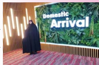
مدیر جامعه الزهرا سلام‌الله‌علیها به اندونزی سفر کرد