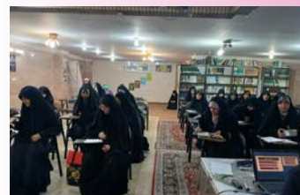
برگزاری کارگاه مهارت‌های پیش از ازدواج ویژه طلاب خواهر در اصفهان