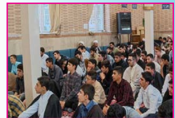
تحصیل ۴۰ هزار طلبة در حوزه علمیه خراسان