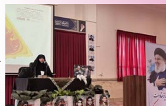
امروز فرزند آوری، جهاد زن است