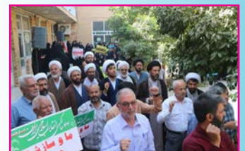
تجمع حوزویان اردکان در محکومیت جنایات رژیم صهیونیستی