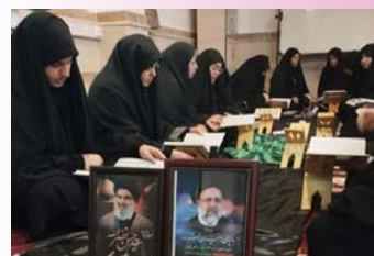
طلاب مدرسه علمیه خواهران هاجر خمین سوره مبارکه یس را تلاوت و ثواب آن را به روح شهید سید حسن نصرالله هدیه کردند