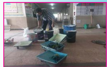
برنامه عمرانی گروه جهادی حوزه علمیه قزوین در شهر اقبالیه