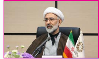
نامگذاری خیابانی به نام یک روحانی یزدی