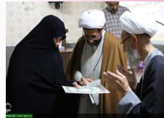
تجلیل از مدیران برتر استانی حوزه‌های علمیه خواران کشور