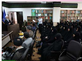
نشست طلاب و اساتید حوزه علمیه خواران کرمانشاه با حضور آیت الله اعرافی