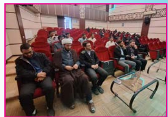
نشست مربیان طرح امین بيجار برگزار شد