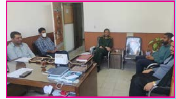
نشست برنامه‌ریزی جشنواره ورزشی طلاب مدارس علمیه کاشان