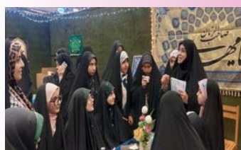
غرفه عفاف و حجاب مدرسه علمیه الزهرا (س) در نمایشگاه بین‌المللی اردبیل برپا شد