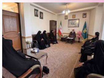
دیدار طلاب جدید ورود حوزه علمیه خواران حضرت فاطمه الزهرا (س) با امام جمعه شهرستان مرند