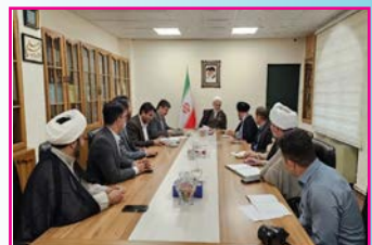
جلسه شورای سیاستگذاری مسکن طلاب و روحانیون کردستان

اهمیت دادن به برنامه‌های فرهنگی بود به گونه‌ای که هیچگاه منتظر فراهم شدن بودجه‌ای نبود و از هزینه خودش برای کار فرهنگی خرج می‌کرد به عنوان مثال برای نوجوانان پایگاه از شهریه طلبگی خود لباس نظامی خرید.