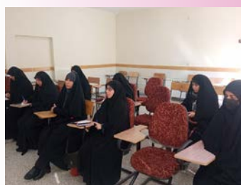
برگزاری کارگاه فنون مناظره در اراک