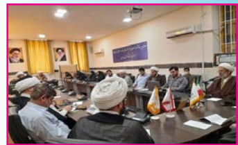
برگزاری مراسم افتتاحیه «رشته تخصصی امامت» در استان کرمانشاه