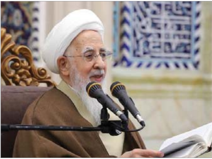
آیت‌الله العظمی جوادی‌آملی

ایشان صبر و استقامت آن حضرت در مقابل مشکلات را مثال‌زدنی خواندند و افزودند: صبر آن حضرت تا بدانجا بود که مصائب خودش را نیز با همسرش بیان نکرد و امیرمؤمنان ؑ هنگام تغسیل، متوجه بازوی ورم‌کرده ایشان بر اثر ضربه شدند.