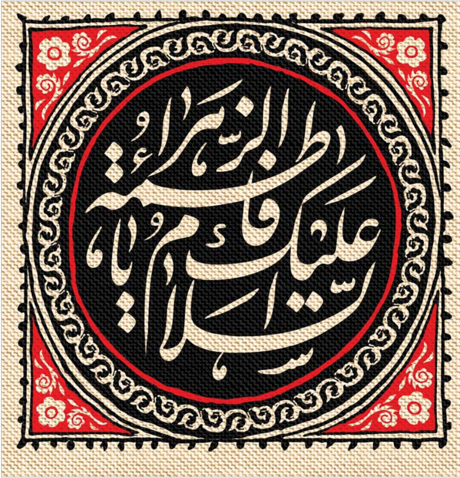
صحیفه امام علیه السلام ، ج۳، ص۳۲۷

بنده به آقایی که دنبال تحقیق هستند، توصیه می‌کنم به ماده «رفس» مراجعه کنند. وی در این کتاب می‌گوید: «رَفْس یعنی زدن با پا در سینه یا پهلوی انسان.»