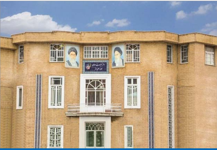
ساختمان دفتر تبلیغات اسلامی حوزة علمیه قم، ۵ محور مهم و حائز اولویت در پژوهش‌های این مؤسسه حوزوی