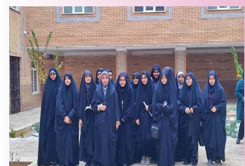
بازدید دانشجویان دانشگاه فرهنگیان اراک از مدرسه علمیه ریحانه النبی (س)