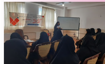
برگزاری دوره کمک‌های اولیه برای طلاب خواهر میبیدی