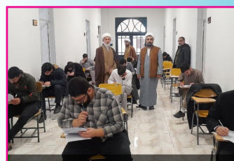
رقابت ۱۳۰ طلبه آذربایجان شرقی در المپیاد علمی