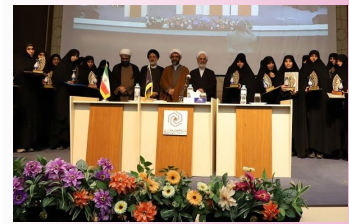
پیشنادهای استاد شاخص کشوری برای طلاب جوان‌تر