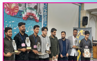
درخشش طلبه هرمزگانی در ششمین رویداد سراسری تولید محتوای دیجیتال بسیج