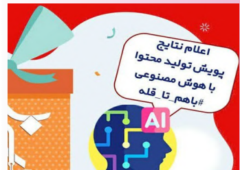
طلبه خواهر بسیجی حوزه علمیه خراسان، منتخب پویش تولید محتوا با هوش مصنوعی «بام تا قله» شد