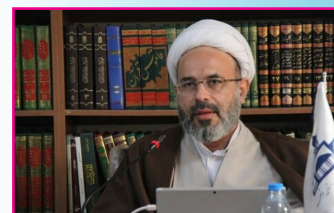
اساتید حوزه با آموزش ۲۶۰ ساعت طرح تعالی، گواهی پایان دوره دریافت می‌کنند