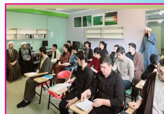
دوره طرح ولایت استانی در حوزه علمیه آذربایجان شرقی برگزار شد