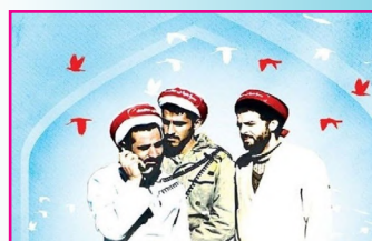
اولین یادواره شهدای روحانی ارتش برگزار شد