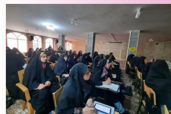
برگزاری کارگاه علمی - پژوهشی هوش مصنوعی در مدرسه علمیه فاطمیه اندان خمینی شهر