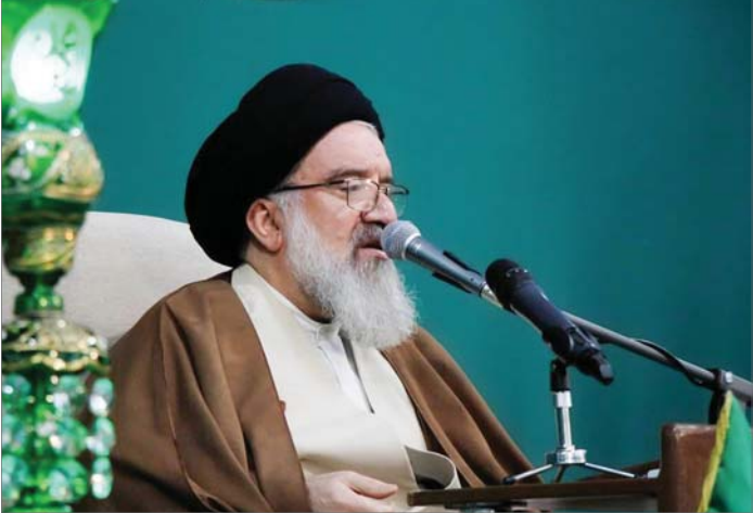
عضو فقهای شورای نگهبان

آیت‌الله خاتمی، با بیان اینکه امام راحل مبارزه‌اش را از عینیت دین با