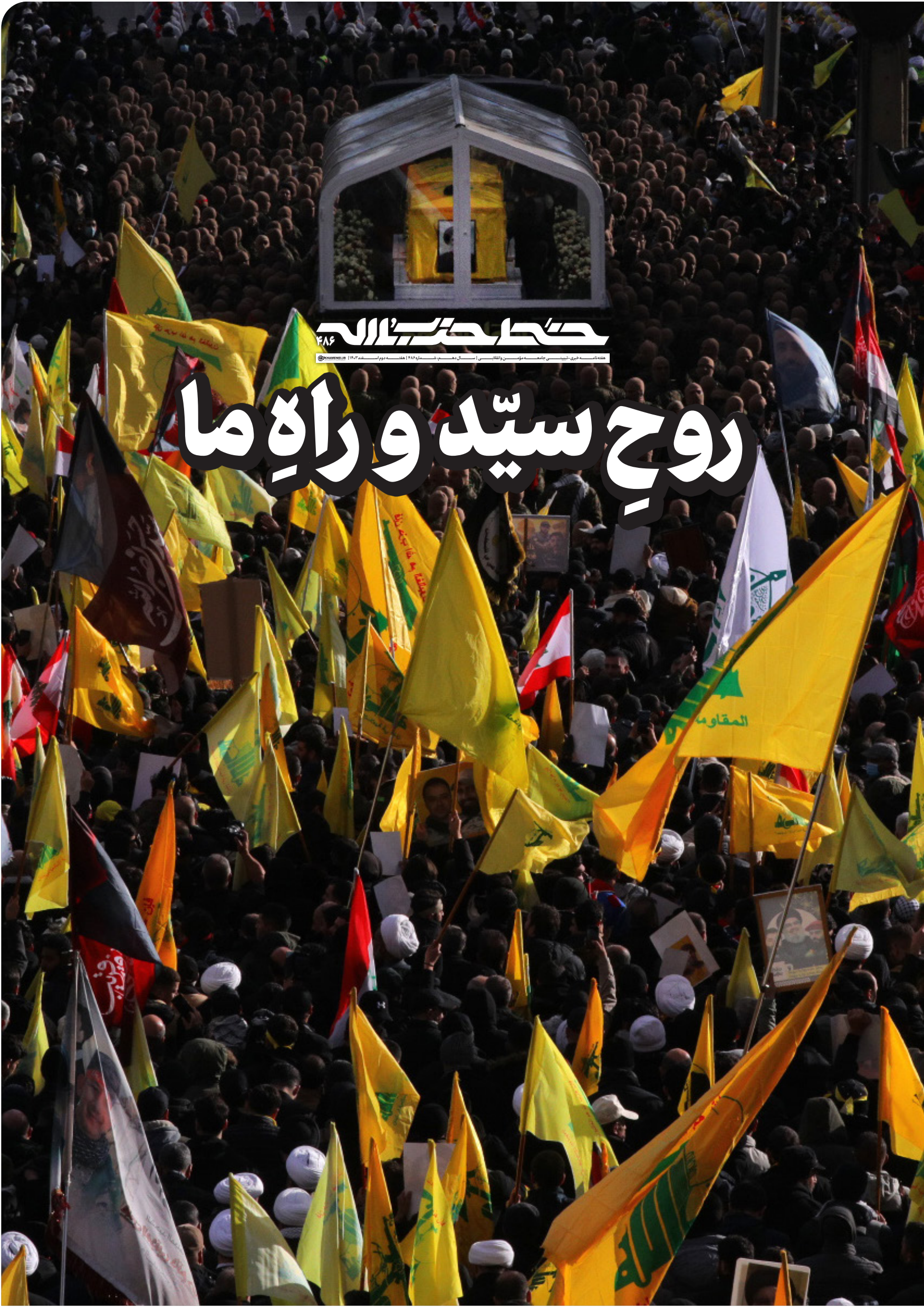
سرود۱ بیروت؛ خبرنگار خط‌حزب‌الله؛ پیش از طلوع خورشید، خیابان‌های منشعب از جاده فرودگاه‌که به ورزشگاه کمیل شمعون منتهی می‌شد، مملو از جمعیت تشییع‌کننده بود.

خانواده‌ها تماماً بیرون آمده بودند تا در آخرین دیدارشان با مقتدای خود شرکت کنند، تا جایی‌که در خانه‌ها تنها کسانی ماندند که بیماری یا پیروی مانع از حرکتشان شده بود. همه در تشییع سید حضورداشتند.